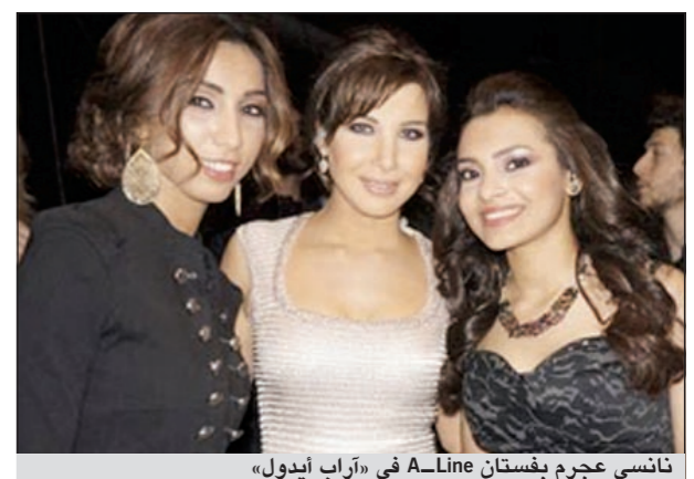
نانسي عجرم بفيستان A-Line في «أراب أيدول»

نانسي منذ أسابيع ضمن برنامج «أراب أيدول» بفيستان A-Line. محبوك من مجموعة عز الدين عليا لربيع 2012. والتصميم يليق بشخصية النجمة اللبنانية المعروفة بلامحها الطفولية وقد زاد لونه المائل إلى الفضي والوردي الشاحب من بساطته الأنيقة. من جهتها، أطلقت الابنة «الأكبر حجما» لعائلة كارديشيان خلال فبراير الماضي وهي ترتدي نفس الفيستان وذلك لإطلاق الموسم الجديد من برنامجها Lamar الذي يجمعها بزوجة لاعب كرة السلة لامار أودم.