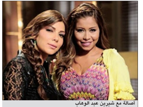
أصالة مع شيرين عبد الوهاب