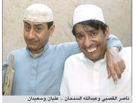
ناصر القصبي وعبدالله السحان .. عليان وسعيدان

حصد ظهور الفنان السعودي ناصر القصبي في أول حلقة من «غات تالينت 2» إعجاب الصحافة اللبنانية والخليجية على حد سواء، حيث استطاع القصبي تجاوز