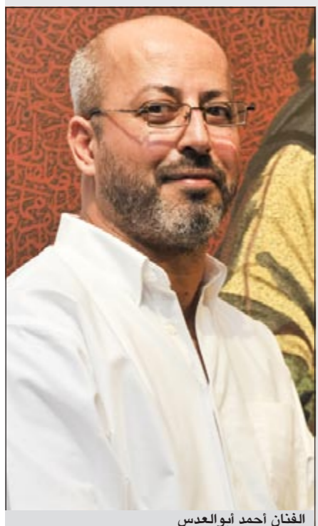
الفنان أحمد أبو العديس