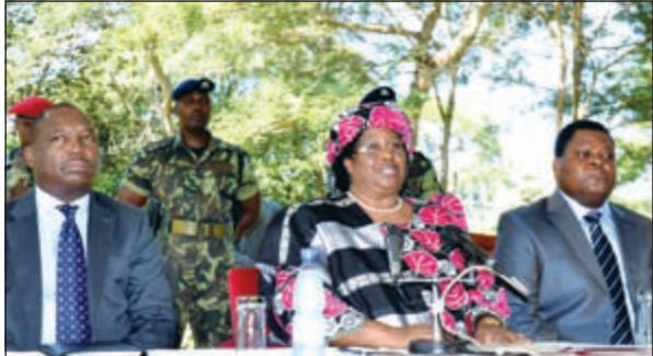
رئيسة مالاوي الجديدة جويس باندا خلال إعلان توليها المنصب (أ.ف.ب)

وكانها من كبار المنحيين للمالوي الى ان جمدتا معونات حجمها ملايين الدولارات بسبب خلافات مع موتاريكا بشأن رئيسة مالاوي الجديدة جويس باندا خلال إعلان توليها المنصب (أ.ف.ب)