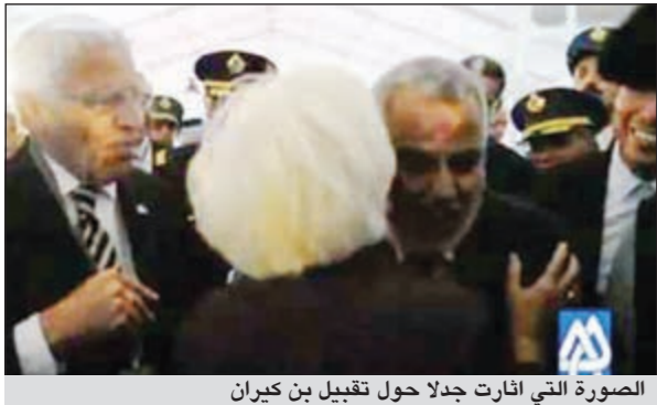
الصورة التي اثارته جدلاً حول تقبيل بن كيران

الجمهور، حتى يمكن للنفس من التأهب للمزيد. وعلق آخر فقال: السيد بن كيران تعامل مع السيدة في حدود اللباقة المتعارف عليها دولياً، فكيف تريد ان يتصرف في مثل هكذا حالات؟ بن كيران لم تكن له النية في تقبيل السيدة العجوز كل ما