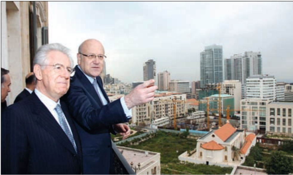
رئيس الحكومة نجيب ميقاتي مستقبلاً نظيره الإيطالي ماريو مونتي في السراي الكبير (محمود الطويل)

عن الأجهزة الامنية، لكنه استدرك قائلاً انه لا يستطيع تقديم هذه الداتا لأحد لأنها تعتبر الامر اغتصاباً للحرية الفردية، مشيراً الى ان مجلس الوزراء قرر ان هذه الداتا تعطى بقرار من الهيئة القضائية المنشأة لهذه الغاية. والواقع ان مسألة داتا الاتصالات التي وفرت للأجهزة الامنية كشف الكثير من خفايا اغتيال الرئيس رفيق الحريري ورفاقه الى جانب شبكات التجسس لحساب إسرائيل، اعدت الى الواجهة مشكلة قديمة، فسين وزارة الاتصالات وغرفة التحكم والهيئة القضائية والاجهزة الامنية «ضاعت الطابسة»، بينما بقي الجناة من مغدفي الاغتيالات ومركبي الافعال المغايرة للقوانين احراراً طلقاءً، في حين يستمر الجدل بين وزير الاتصالات والنقوى الامنية حول جنس الجهة التي يحق لها الاطلاع على مضامين ملكة الاسرار الهاتفيه، فيما الامن يهتز، وغدا المزيد من القيادات البارزة في مرمى النيران.