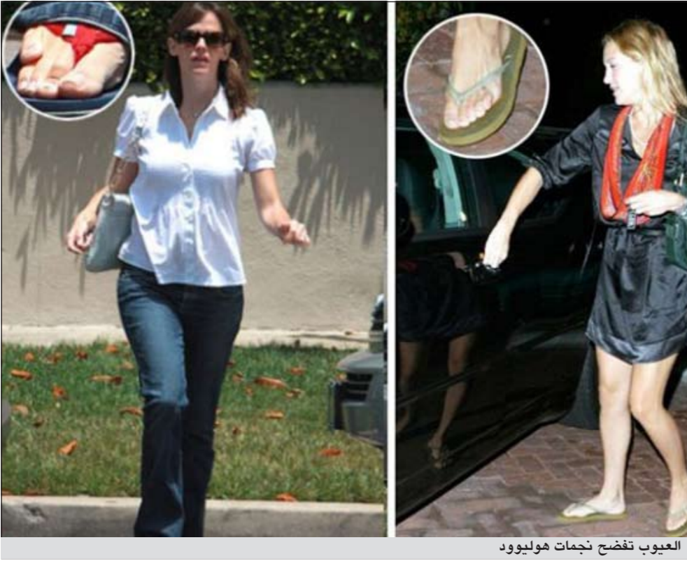
العيوب تفضح نجما هوليوود

وكالات: حقق فيلم «تايتانيك» للمخرج جيمس كاميرون مبلغ خمسة ملايين دولار في عرضه الاول بدور السينما. وعلى الرغم من ان الرقم اقل قليلا من المتوقع، الا انه يوحى بإمكانية تحقيق الفيلم لـ 40 مليون دولار تقريبا في نهاية الاسبوع، مما يدعم حظوظه في تجاوز إيراداته الإجمالية الملياري دولار. وبمناسبة الذكرى الـ 100 لغرق السفينة العملاقة عام 1912، قام المخرج جيمس كاميرون بتعديلات تقنية كبيرة بنسخة العمل، ليحولها الى «ثري دي» واعاد طرحه في دور السينما منذ اول من امس. ويجني الفيلم اللبلة الأخيرة على سفينة «تايتانيك» التي غرقت في رحلتها من بريطانيا الى اميركا عقب اصطدامها بجبل جليدي.