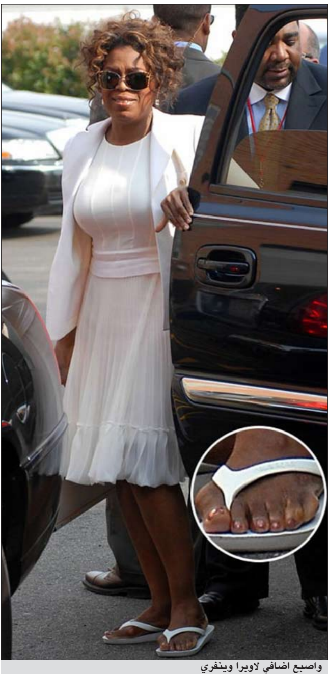
واصبع اضافي لابورا وينفري

بيبي - ام.بي. سي: قد يظهر في انبي حلهن امام عدسات الكاميرا، لكن نجومات هوليوود يملكن بداخلهن عيوباً يسعين جاهداً لتخفيها، وإن كانت محاولتهن تفشل في بعض الأحيان. وكشفت صور مؤخراً بعض العيوب في أقدام عدد من الممثلات ومقدمات البرامج على وجه التحديد.