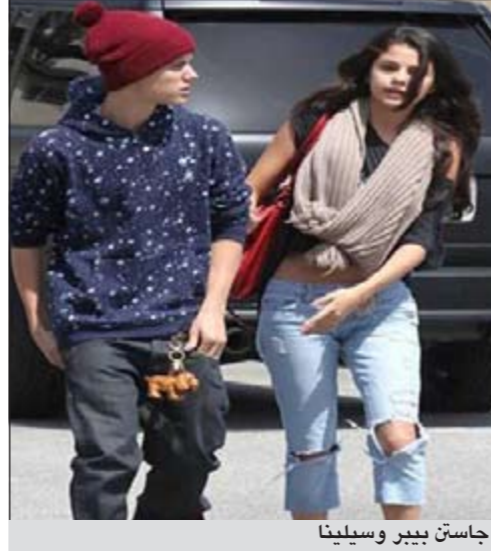
جاستن بيبير وسيلينا

وكالات: شهود الثنائي الاكثر شهرة مجددا في نزهة رومانسية بسيطة، حيث توجهت سيلينا غوميز مع حبيبها جاستن بيبير لتناول الغداء في مطعم panera Bread في كاليفورنيا. وارتدت سيلينا لهذه النزهة سروال جينز ممزق وقميص مربوط كشفت من خلاله بطنها المشدود وكان جاستن بيبير يرتدي سروالا واسعا جدا baggy الذي كاد ان يسبب له فضيحة بعد ان انخفض بشكل كبير وظهر سرواله الداخلي من ماركة لويس فيتون.