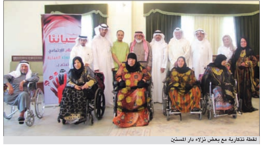
لقطة تذكارية مع بعض نزلاء دار المسنين