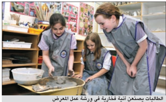
الطلاب يصنعون آنية فخارية في ورشة عمل المعرض