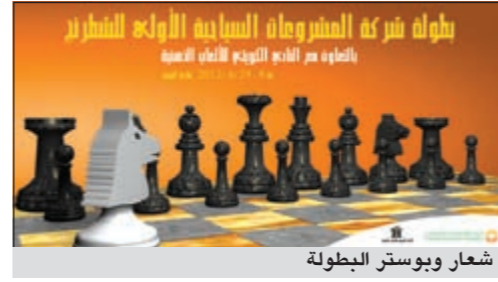
شعار وبوستر البطولة