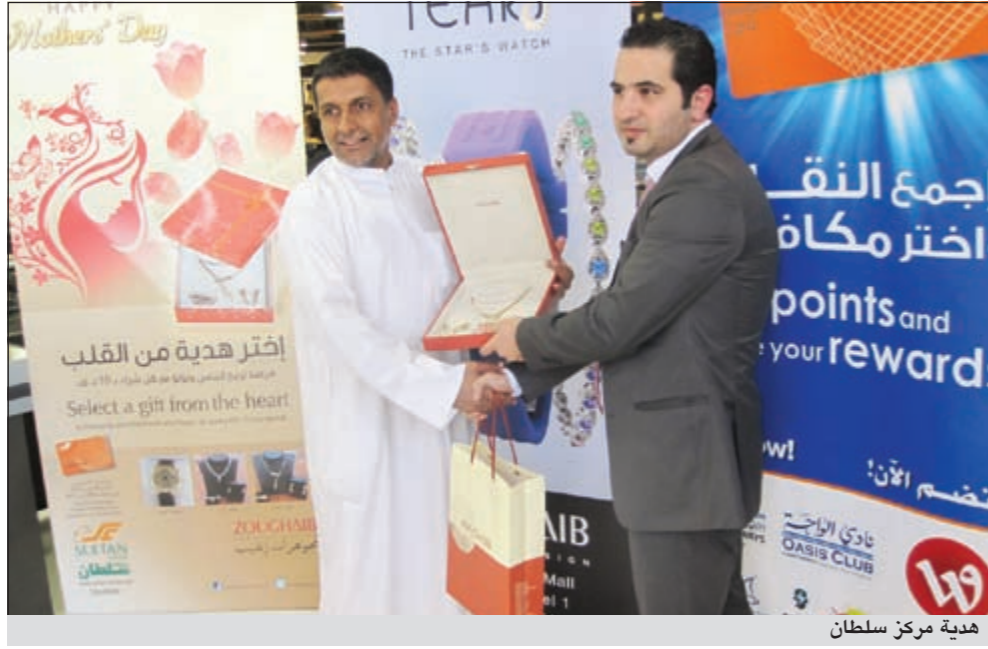
هدية مركز سلطان