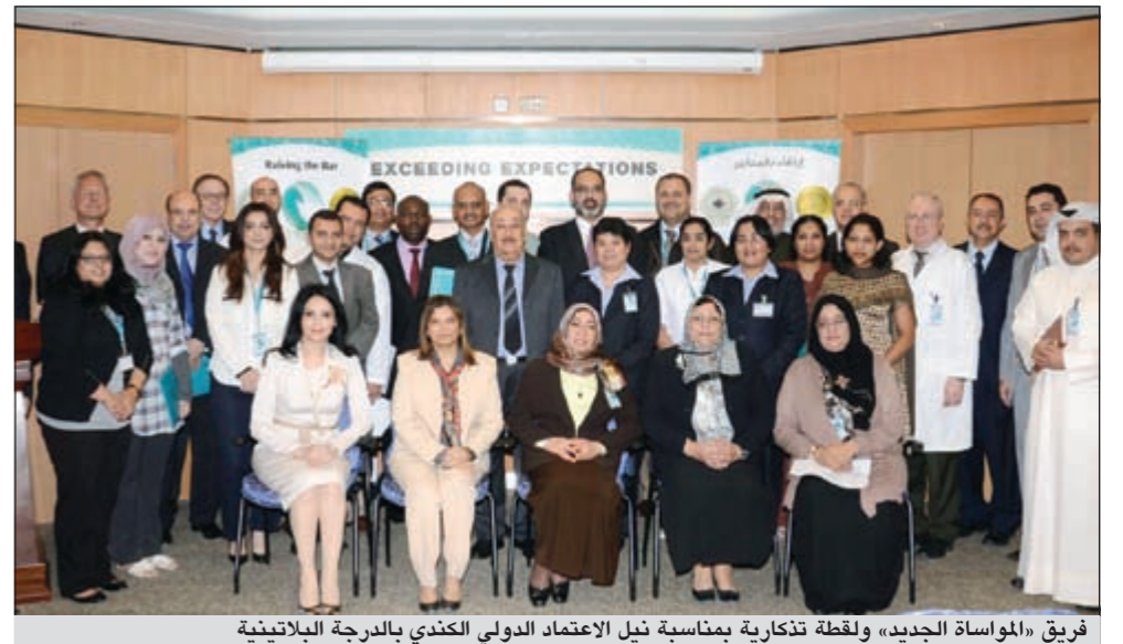
فريق «المواساة الجديد»، ولقطة تذكارية بمناسبة نيل الاعتماد الدولي الكندي بالدرجة البلاتينية