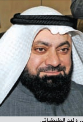
د. وليد الطبباني

قدم النائب د. وليد الطبباني اقتراحاً برغبة جاء في مقدمته: لما كان مجلس الوزراء الموقر قد رفع بدوره الخطة التنموية للدولة الى مجلس الأمة الذي اقرها بعد ذلك، كان لزاماً أن تكون هناك متابعة جدية لتلك الخطة ومدى تنفيذ ما جاء فيها، وفي ضوء ذلك محاسبة المسؤولين ومراقبتهم. ونص الاقتراح على قيام الامانة العامة للمجلس الأعلى للتخطيط والتنمية بإنشاء وحدات لمتابعة مؤشر الخطة التنموية في كل أجهزة الدولة.