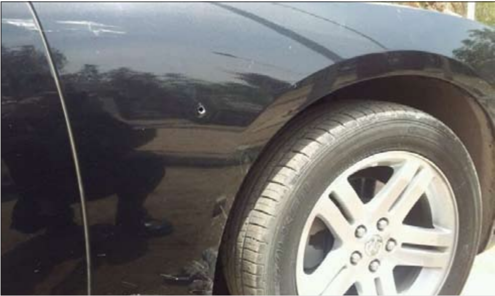
المركبة وتبدو عليها آثار اطلاق النار

وأكد ما سبق ذكره في بلاغه للعمليات وأرشد عن المنزل الذي خرجت منه الاعيرة النارية. وأضاف المصدر: انتقل رجال الأمن الى المنزل «مصدر النيران» وخرج شاب ومرافقه ونفيا الادعاء الا ان رجال الأمن طلبا منهما أن يرافقهما الى المخفر الا انهما رفضا وقاوما رجال الأمن، لتتم السيطرة عليهما وتبين ان أحدهما عليه سوابق متعلقة باقتحام مخفر التعميم وصادر بحقه حكم بالسجن 4 سنوات.