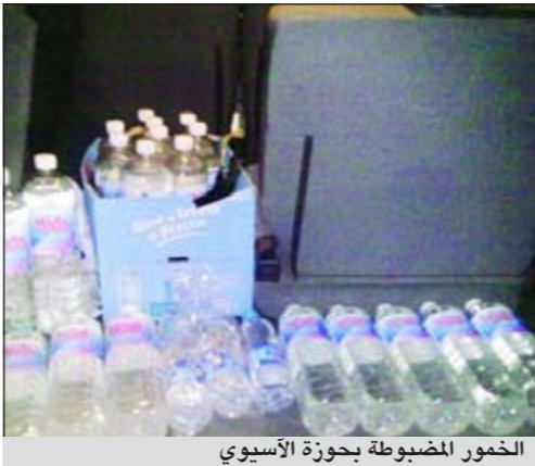
الخمور المضبوطة بحوزة الأسوي

أحال رجال امن حولي يوم امس واقدا أسويوا السى مقر الادارة العامة لمكافحة المخدرات بعد ان تم ضبطه وبحوزته 20 بطل خمر محلية، وقال مصدر امني ان رجال نجدة حولي اوقفوا أسويوا خلال حملة تفتيشية حيث ظهرت عليه علامات الارتباك الشديد، وهذا ما دعا رجال الامن الى اخضاعه للتفتيش ليعثر رجال الامن بحوزته على 20 زجاجة خمر.