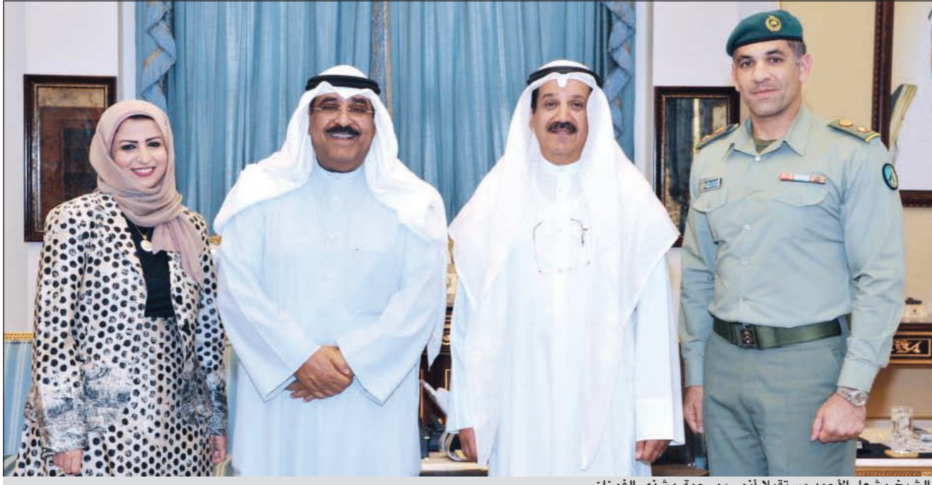
الشيخ مشعل الأحمد مستقبلاً أنور بورحمة وشذى الفوزان

بالتعاون مع الجمعية الكويتية لمكافحة التدخين والسرطان منذ 13 مارس الماضي، والتي استمرت حتى 5 أبريل الجاري، كما أطلع على النتائج الأولية للحملة. وأثنى الشيخ مشعل الأحمد على ما بذل من جهود خلال أنشطة الحملة، معرباً عن بالغ سروره بالتعاون المثمر بين الحرس الوطني والجمعية الكويتية لمكافحة التدخين والسرطان، مشيراً إلى عزم الحرس الوطني على استمرار مثل هذه الحملات التوعوية بصفة دورية، داعياً للجميع بالتوفيق والسداد لتحقيق الأهداف وبلوغ الغايات من أجل خير الوطن العزيز وصلاح أبنائه الأوفياء، وفي نهاية اللقاء، كرم الشيخ مشعل الأحمد أنور بورحمة وشذى الفوزان على ما بذل من جهود مخلصه، وتمنى لهما التوفيق والسداد في خدمة الوطن العزيز. حضر المقابلة العميد جمال محمد الذياب مدير مكتب نائب رئيس الحرس الوطني.