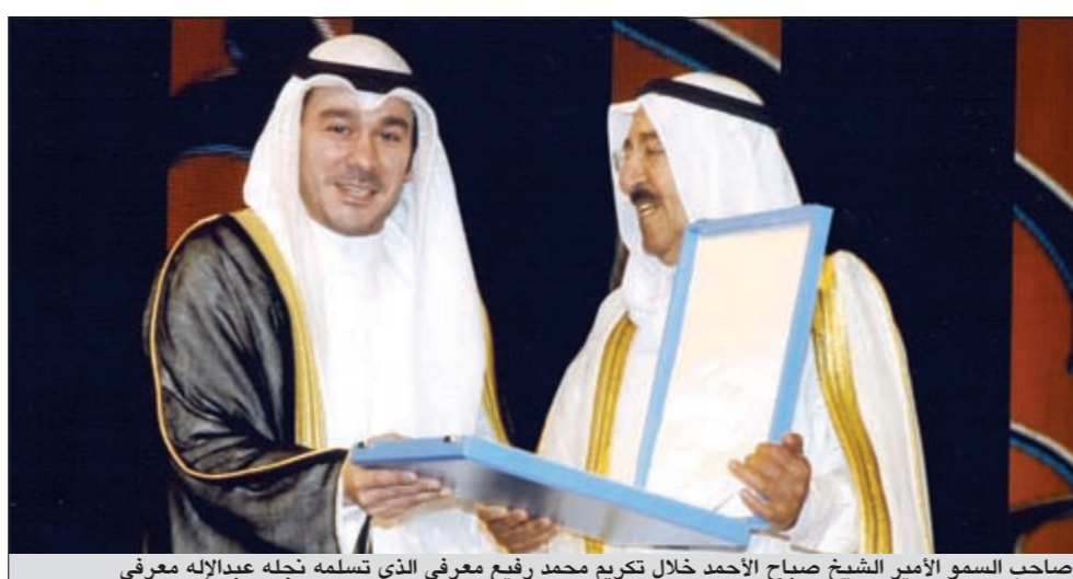
صاحب السمو الأمير الشيخ صباح الأحمد خلال تكريم محمد رفيع معرفي الذي تسلمه نجله عبدالإله معرفي

ثخن آل معرفي المكرمة الأميرية لصاحب السمو الأمير الشيخ صباح الأحمد لقيامه بتكريم أعضاء المجلس التأسيسي للدستور بمناسبة مرور خمسين عاماً على تأسيسه. وقال عبدالإله معرفي نجل المغفور له بإذن الله تعالى محمد رفيع معرفي إن هذه المكرمة الأميرية ليست بجديدة وإنما تصيف لبنة جديدة في بناء هذا الوطن العزيز. وقال أن تقليد صاحب السمو الأمير لوالده وسام الكويت ذا الوشاح من الدرجة الممتازة يعد وسام فخر واعتزاز لجميع آل معرفي والشعب الكويتي. واستذكر عبدالإله معرفي تلك المرحلة في المجلس التأسيسي الذي جاء اتفلاقاً من إيمان الكويت بإرساء الديموقراطية والحياة النيابية الحرة الكريمة لمواطنيها حين بادر الأمير الراحل الشيخ عبدالله السالم الصباح، طيب الله ثراه، بعد الاستقلال مباشرة بإصدار مرسوم أميري يدعو فيه الناخبين بتاريخ 1961/12/30 لانتخاب مجلس تأسيسي يعتبر الأول من نوعه في البلاد تناط مهمته وضع الدستور مع الحفاظ على وحدة الوطن واستقلاله في ظل حكم عادل مستختر يعارض الشعب من خلاله حياة نيابية بالانتخاب الحر المباشر ويقول كلمته باختيار ممثله وأضاف معرفي أنه: انطلاقاً من رغبة المغفور له والذي في المشاركة وإرساء قواعد الديموقراطية والحياة النيابية