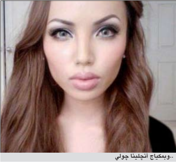
..وبمكياج أنجلينا جولي