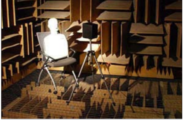
أهدأ غرفة في العالم

عن مختبرات «أورفيلد»، حدث المكان الأكثر هدوءا في العالم منذ عام 2004 وحتى الآن، وذلك بحسب موسوعة «غينيس» العالمية للأرقام القياسية. وبعد المكان الأهدأ في العالم بمنزلة غرفة ماصة للصوت وكاتمة للصوت، حيث إنها مصنوعة من 99,99% من المواد العازلة للصوت، والتي لا يمكن لأي شخص التواجد بها سوى 45 دقيقة على الأكثر