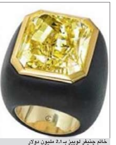
خاتم جنيفر لوبيز بـ 2,1 مليون دولار

لوس انجليس - يو.بي.سي: خطفت النجمة الأميركية جنيفر لوبيز الأنظار خلال اطلالها في حلقة برنامج «أميركان آيدول» بختام تتميز بماسة صفراء اللون تقدر قيمته بـ 2,1 مليون دولار. وذكر موقع «بيبول» الأميركي ان لوبيز وضعت في الحلقة خاتما ماسيا من تصميم كورا يزن 50,40 قيراطا وثمنه لا يقل عن 2,1 مليون دولار. وأشار الى ان الماسة الصفراء المميزة من أفريقيا