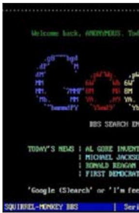
الوان كثيرة، بحسب صحيفة «ديلي ميل» البريطانية الخميس 5 ابريل 2012.

وتلقت الفيديوهات التي ينشرها هذا الموقع لطريقة استخدام هذه المواقع بأسلوب وشكل الثمانينيات، قبولا هائلا على يوتيوب، حيث تتجاوز مشاهدة الفيديو الواحد عشرات الآلاف. كما أن الموقع لا يترك شيئا للمصادفة، فقد أضاف خدمة الأخبار التي تنشر أخبارا قديمة منذ الثمانينيات، مثل: رونالد ريغان يزور بلجيكا عن طريق المصادفة وآل جور يخترع شبكة الإنترنت.