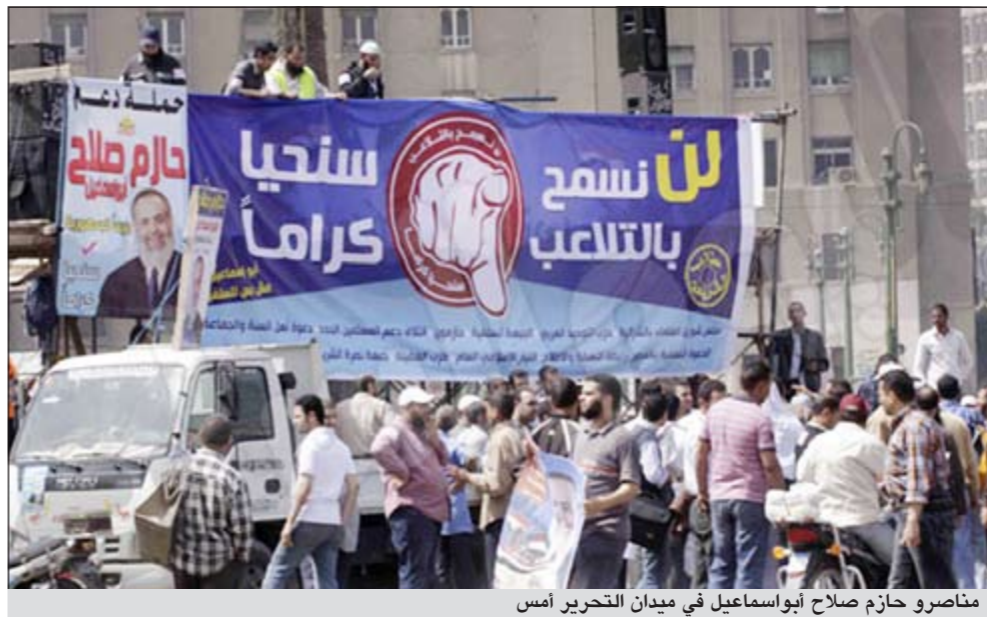
منصور حازم صلاح أبو إسماعيل في ميدان التحرير أمس

وأضاف «ولكن الأمر المؤكد هو أن موقفاً صحيح تماماً ولا شبهة فيه ونسال الله أن يفضح افتراءهم وأن يبطل كيدهم وأن يرد تدبيرهم هزيمة عليهم يا رب العالمين، وأرجو من إخواني جميعاً أن يثبتوا وأن يلزموا الدعاء فهي محنة لكنها توشك إن شاء الله أن تتحول إلى نصر كبير والله المستعان».