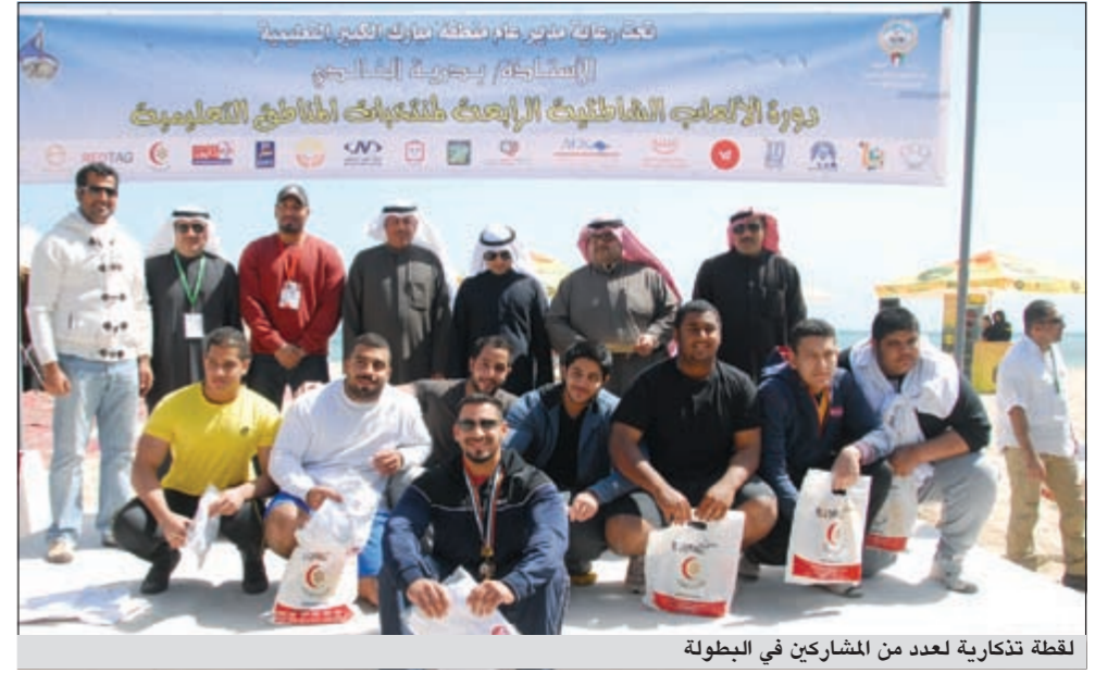
لقطة تذكارية لعدد من المشاركين في البطولة