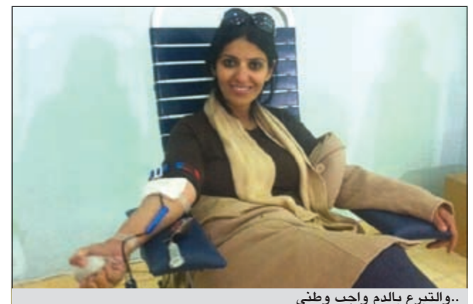
... والتبرع بالدم واجب وطني