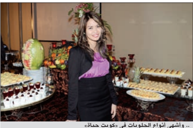
.. وأشهى أنواع الحلويات في «كويت حياة»

وأكد بلوط أهمية التواصل مع الإعلاميين ودورهم البناء في طرح القضايا التي تهم الناس، كما قدم عرضاً لإنجازات الفندق خلال الفترة الماضية واستراتيجية «كويت حياة» المقبلة والمركزة على العديد من العروض المتزامنة مع عمليات تطوير الفنادق ومرافقها المتنوعة بما يواكب ما تشهده الكويت من نهضة فندقية، وتمنى للحضور قضاء أوقات ممتعة، ثم دعاهم إلى تذوق ما أعدته مطبخة «كويت حياة» من أنواع المشاوي والأطباق بأشهى النكهات إضافة إلى المقبلات وأنواع الحلويات مع الشيشية.