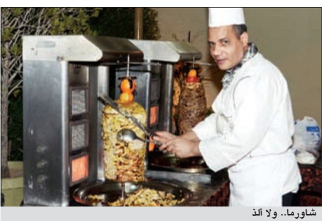
شاورما.. ولا الذ

أقامت أسرة فندق «الكويت حياة» أمسية جميلة تكريماً للإعلاميين والصحافيين بمناسبة انطلاق ليالي الباركيو في حديقة الفندق، التي تزينت لاستقبال زوار الفندق وعشاق الباركيو ليلتي الخميس والجمعة.