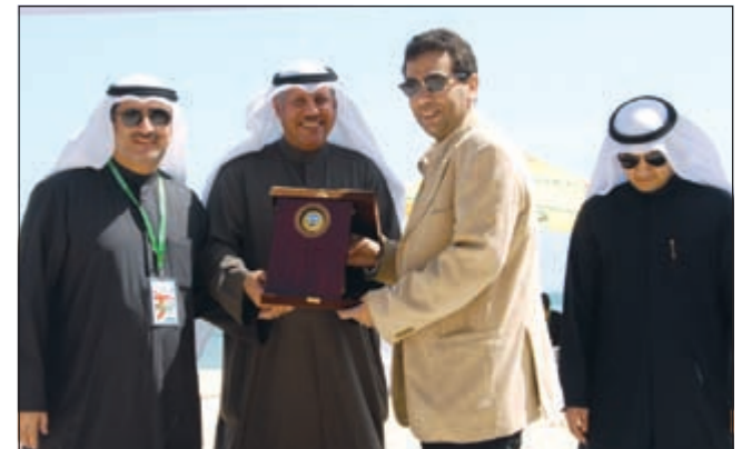
درع تكريمية تقديراً للجهود المبذولة

في جو من التنافس الشريف والمحمود أقيمت دورة الألعاب الشاطئية الرابعة لمنتخبات المناطق التعليمية بمنطقة المسيلة تحت