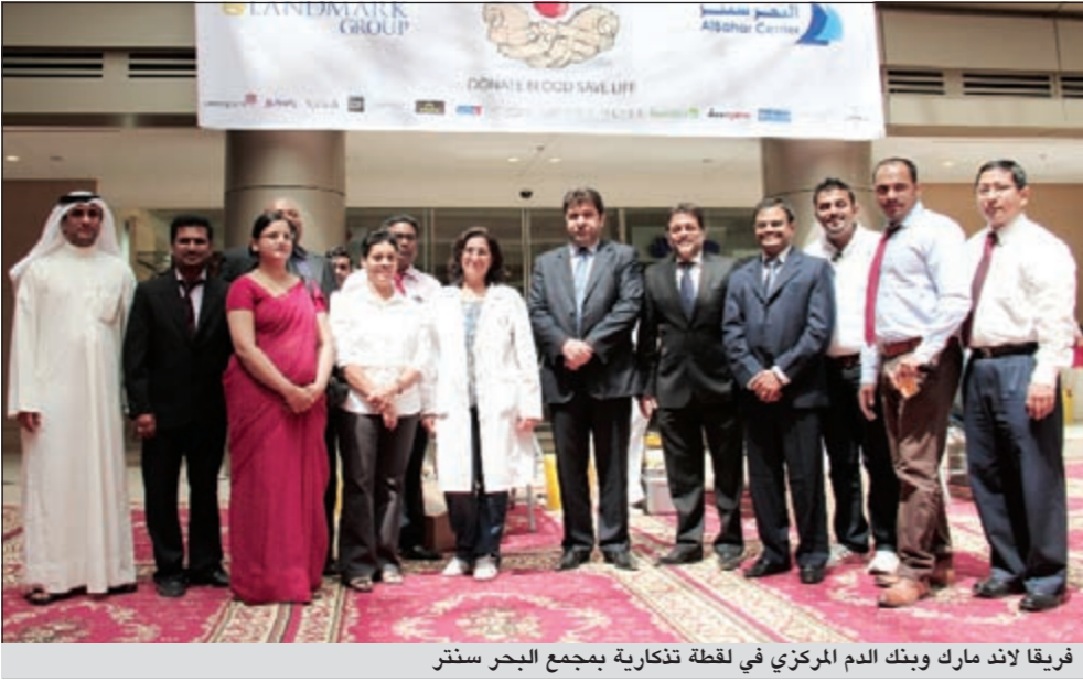
فريقاً لاند مارك وبنك الدم المركزي في لقطة تذكارية بجمع البحر سنتر