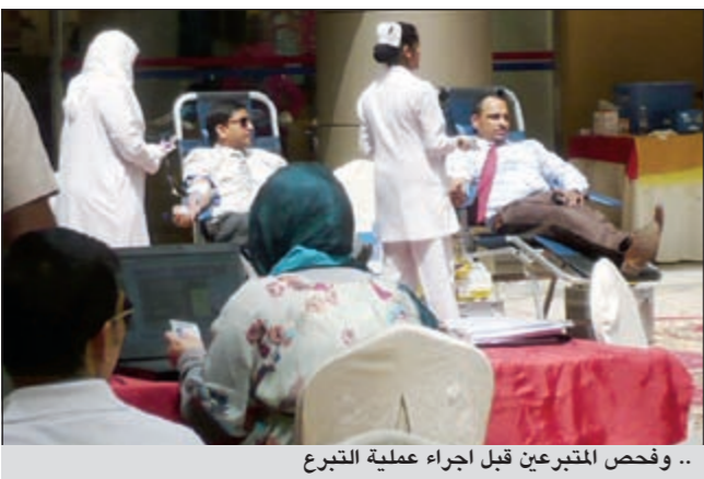
... وفحص المتبرعين قبل إجراء عملية التبرع