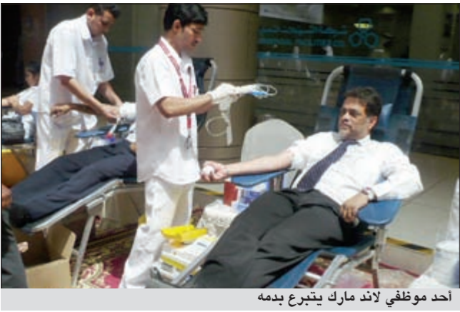
أحد موظفي لاند مارك يتبرع بدمه