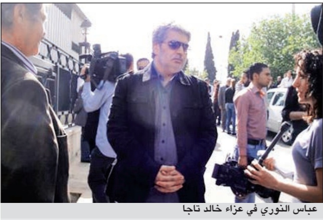
عباس النوري في عزاء خالد تاجا