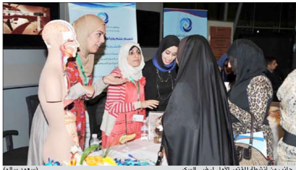
جانب من أنشطة المؤتمر الأول لمرضى السكر (سعود سالم)