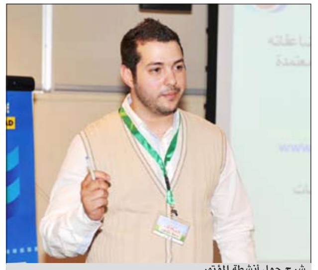
شرح حول أنشطة المؤتمر