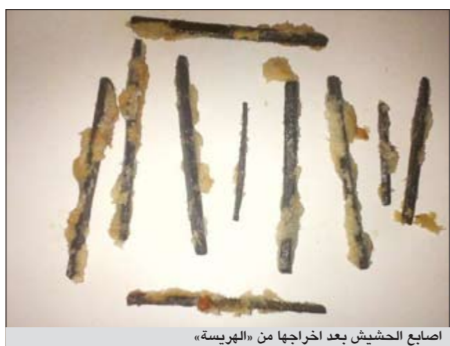
أصابع الحشيش بعد إخراجها من «الهريسة»

لم تمر عليهم الخدعة حيث اكتشفوا أن الكمية 10 قطع من الحشيش الصافي والمعد للتعاطي.