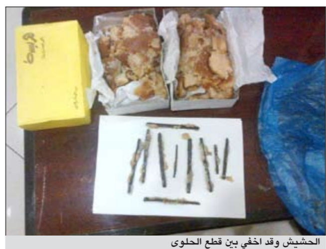
الحشيش وقد اخفي بين قطع الحلوى

الجوالة حصلت دون وصول الوافد المصري الذي بر الأمان بمرنوعات بعد أن اشتبهوا به أثناء مجيئه إلى البلاد حيث ظهرت عليه علامات الارتباك وبتفتيش أمتعته تبين أن الوافد المصري قد استبدل مكسرات الهريسة بقطع الحشيش التي وضعت بطريقة مبتكرة داخل الحلوى على هيئة أشكال زينة للهريسة إلا أن رجال المطار