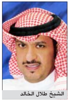
الشيخ طلال الخالد

أعلن العضو المنتدب للعلاقات الحكومية والبرلمانية والعلاقات العامة والإعلام الشيخ طلال الخالد أن مؤسسة البترول الكويتية ومن منطلق مسؤوليتها الاجتماعية ستعري مؤتمرًا دوليًا للاندحام المروري قريبًا لمناقشة المشاكل المرورية في الكويت وسبل حلها.