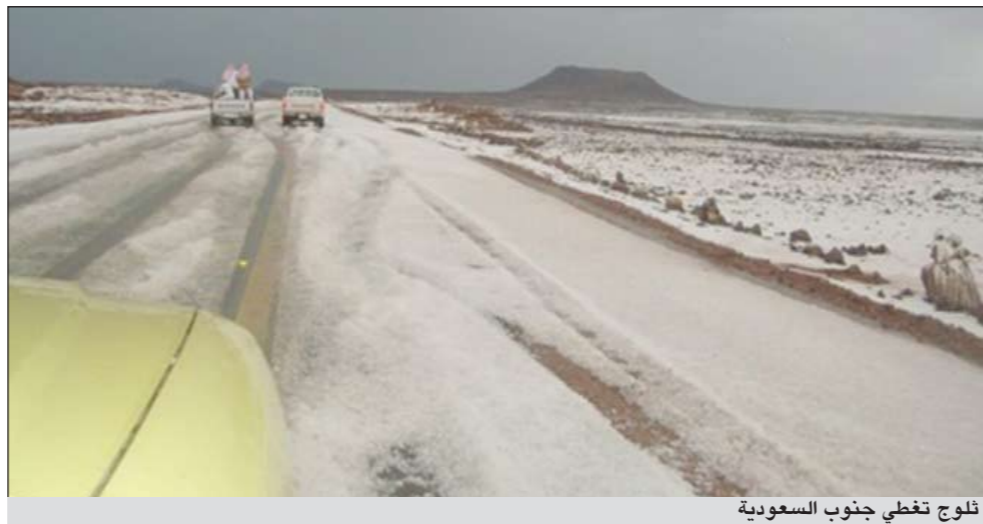
ثلوج تغطي جنوب السعودية

عن وجود احتجازات عدة في كثير من المواقع، وتم التعامل معها في حينه عن طريق فرق الدفاع المدني. وتم إخلاء أسرة مكونة من عشرة أشخاص (6 رجال و4 نساء) من مركز جرب نتيجة لمداهمة السيول لماواهم، وجرى التنسيق مع المالية وتأمين الماوى