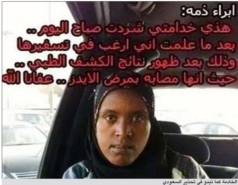
الخادمة كما تبدو في تحذير السعودي

الرياض - العربية: تسببت صورة لخادمة أسبوية في هلع الكثير من السعوديين، بعد أن حذر كفيها من التعامل معها بحجة أنها مصابة بمرض «الإيدز». ووصلت رسائل السعودي المتكررة مئات من أرقام الجوالاات في السعودية، إضافة إلى تحذيرات في مواقع التواصل الاجتماعي الأربعاء. ووضع المواطن إعلاناً تحذيرياً مرفقاً بالصورة التي وصلت كرسائل ورسائل عبر أجهزة الجوال، تتضمن توضيحاً منه أن خادمته مصابة بالمرض عقب أن أجريت لها فحوصات طبية قبل هروبها، وحذر كفيها أي أسرة من إيوائها أو التعامل معها، وتناقلت مواقع ومنتديات إخبارية وعامة تلك الرسائل التحذيرية. ولم يحدد المواطن مقر إقامته، فيما أكد مصدر أمني في وزارة الداخلية في اتصال مع «العربية.نت» أن الأمر محل متابعة، وتجري الوزارة بحثها لمعرفة موقع ومكان صاحب تلك الرسائل والتحذيرات.