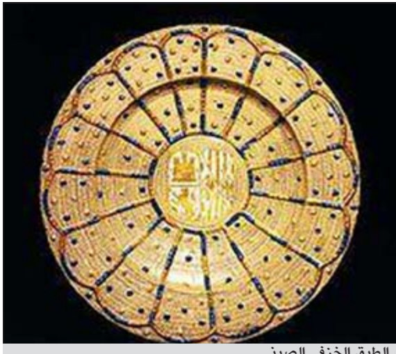
الطبق الخزفي الصيني

بيجينغ - يو.بي.أي: بيع طبق خزفي صيني قديم نادر بمزاد علني في هونغ كونغ مقابل 26,65 مليون دولار مسجلاً رقماً قياسياً عالمياً لأسعار الأطباق الخزفية القديمة. وأفادت وكالة أنباء الصين الجديدة (شينخوا) أن دار «سونبي» للمزاد بمنطقة هونغ كونغ باعت مؤخراً الطبق الخزفي الصيني القديم النادر بـ 278,6 مليون دولار هونغ كونغ (26,65 مليون دولار أميركي) مسجلاً رقماً قياسياً عالمياً.