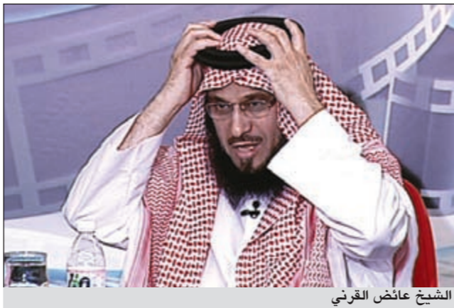
الشيخ عائض القرني

إمسك الغترة عن الطيران، وتسوية الهدام، والمساعدة على النظام، والمدافعة عن النفس في الزحام، وغير ذلك من الأسرار العظيمة والفوائد الكبرى.. وأكد أن «علينا أن ننشغل بالمضمون أكثر من القوالب، والمعاني أكثر من القشور، والمقاصد أكثر من الألفاظ».