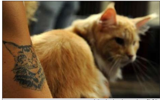
القطعة «بولدي» عادت لصاحبها

العربية: تستعد سيدة ألمانية لتلقي يهرها «بولدي» الذي اختفى قبل 16 عاما، وعاش على ما يبدو خلال تلك الفترة في