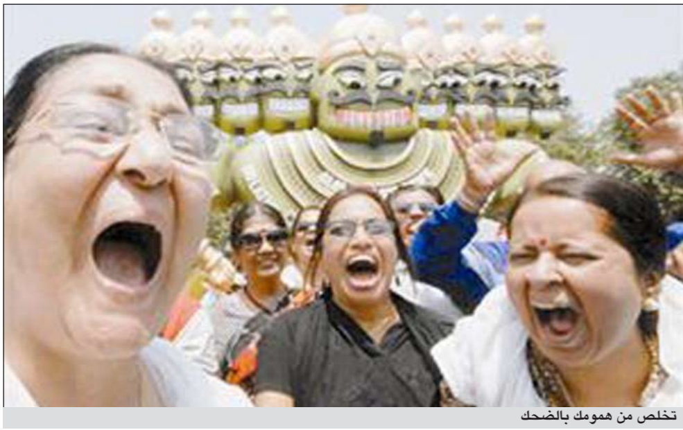
تخلص من همومك بالضحك

أبديهم بعضها ببعض ويسرون مترنحين كطيور الطريق، وفقا لتعليمات الأستاذ، وسرعان ما تتحول الضحكات المصطنعة إلى ضحكات حقيقية.