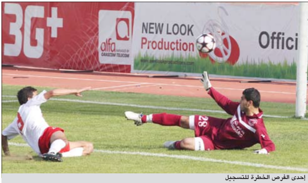
إحدى الفرص الخطرة للتسجيل

البلدي 15 مايو المقبل، الفائز من مباراة الأنصار والصفاء البلدي. 29 الجساري على ملعب صيدا