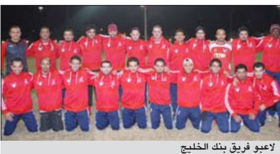
لاعبو فريق بنك الخليج

انفرد فريق بنك الخليج بصدارة قائمة دوري كرة قدم نادي مصارف الكويت في الأسبوع الحادي عشر برصيد 29 نقطة وذلك بعد فوزه على نظيره فريق البنك الدولي بأحد عشر هدفا دون مقابل وتعادله السلبي مع نظيره فريق بنك بويان الذي جاء في المركز الثاني برصيد 19 نقطة وجاء في المركز الثالث فريق بيت التمويل الكويتي برصيد 18 نقطة بعد تعادله الإيجابي بهدف كل منهما مع نظيره فريق بنك الكويت الوطني السذي احتل المركز الرابع برصيد 14 نقطة وجاء في المركز الخامس فريق البنك الأهلي الكويتي برصيد 11 نقطة بعد فوزه على نظيره البنك الأهلي المتحد بثلاثة أهداف نظيفة فيما جاء في المركز السادس فريق البنك الدولي برصيد 7 نقاط واحتل المركز السابع فريق البنك الأهلي المتحد، هذا وتنتقل أنشطة الأسبوع الثاني عشر مساء غد السبت على ملاعب وزارة الإعلام.