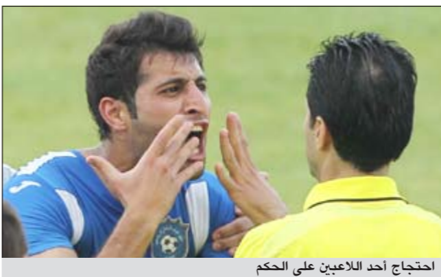
احتجاج أحد اللاعبين على الحكم