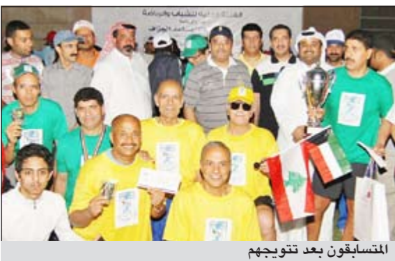
المتسابقون بعد تتويجهم

أعلنت الشركة الوطنية للاتصالات عن رعايتها الماراثون السنوي الذي نظمته الهيئة العامة للشباب والرياضة في 30 مارس الماضي، وذلك برعاية اللواء فيصل الجزاف رئيس مجلس الإدارة.