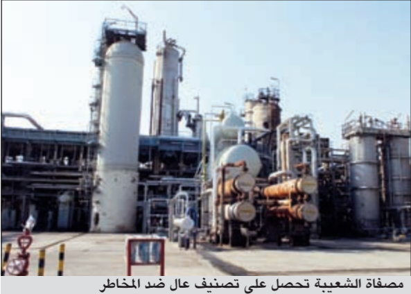
مصفاة الشعبية تحصل على تصنيف عال ضد المخاطر

وتباطأ معدل نمو الاقتصاد الصيني ليصل الى 9,2٪ في عام 2011 مقارنة مع 10,4٪ في العام السابق، ومن المتوقع أن يشهد الاقتصاد نموا معتدلا خلال العام الحالي ليصل الى نسبة 7,5٪ وذلك بتفاع من قوة القطاع الاستثماري والاستهلاكي المحلي على الرغم من تباطؤ الطلب الخارجي. وبلغ مجموع الاستثمار الأجنبي المباشر في الصين في أول شهرين من عام 2012 نحو 17,72 مليار دولار، بتراجع قدره 0,56٪ مقارنة مع الفترة نفسها، وفي الوقت نفسه، ارتفع الاستثمار الصيني في الخارج في القطاعات غير المالية بـ 41,1٪ على أساس سنوي الى 7,44 مليارات دولار في الشهرين الأولين من عام 2012، حيث شاركت 706 شركات أجنبية من 97 بلدا في مناطق مختلفة.