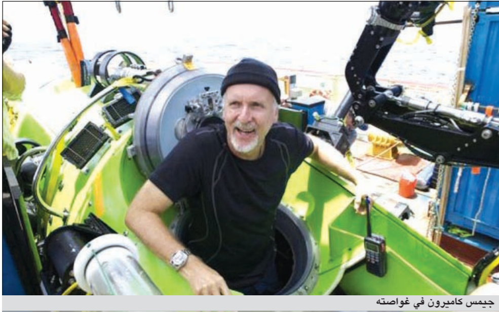
جيمس كامبيون في غواصته

يستعد المغامر والمباردبر البريطاني ريتشارد برانسون للغوص في قاع المحيط الأطلسي لاستكشاف حفرة بورتو ريكو على متن غواصته «فيرجين أوسيانيك».