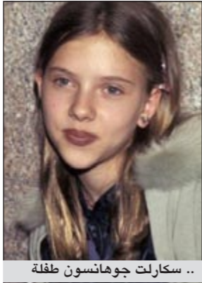
.. سكارلت جوهانسون طفلة