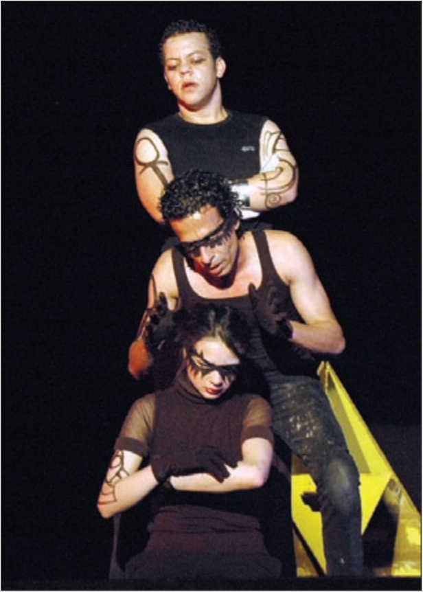
مشهد من مسرحية «مقلوب الهرم»