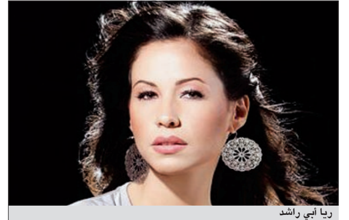
ريا أبي راشد

كشفت ريا أبي راشد مقدمة برنامج Arabs Got Talent، أن خاتم زفافها كان من الألماس، وعمره أكثر من 30 عاماً، وأنها ارتدت فستان زفاف من تصميمات