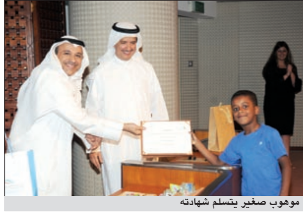
موهوب صغير يتسلم شهادته

الرياضيات والعلوم أو مواهب حسبة مثل الفنون والرياضة. ولدعم المبدعين، يقوم المركز بإبراز مواهبهم من خلال أول معرض يقيمهم أمام المجتمع الكويتي لجمهور: معرض «مواهب».