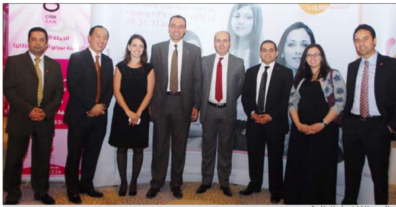
جانب من المشاركين في المحاضرة