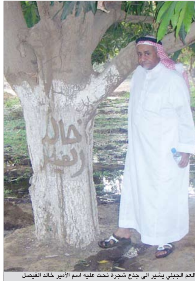
العم الجبلي يشير الى جذع شجرة نحت عليه اسم الأمير خالد الفيصل

جازان الطازج وتلمسنا حلالة الثمار بعد الجهد والعمل المضني، وكما كان الطعام شهياً كانت ثمار المانجو شهية كذلك. يبهرننا اصرار العم الجبلي وشدة باسه في انجاز ما يطمح له دون انتظار مساعدة الآخرين، ويهزنا ذاكرته والمعينة في رواية ادق التفاصيل قبل عشرات السنين. اخذنا الى مدرج كبير اسفله ساحة يعولها مسرح، قال انه سيكون مكاناً للاحتفالات التي يمكن ان تقام في المدينة والمدرج منفصل الى قسمين، احدهما للرجال والآخر للنساء. حديثه عن المانجو يشبه حديث احدهنا عن اعز ما لديه عن ولده الذي عايشه وليداً ثم رضيعاً ثم صبياً، ففتى يافعا فشاباً قويا، هكذا هي الآن مزرعة المانجو، شامخة بأشجارها شاهدة على تقدمها لضيوفه، وذقنا مانجو