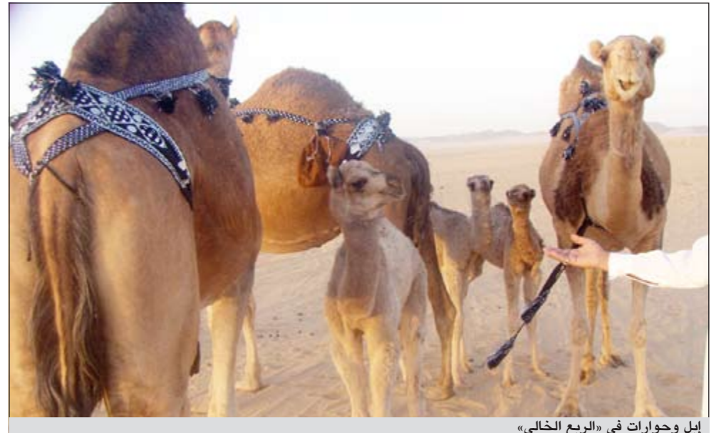
إبل وحوارات في «الربيع الخالي»