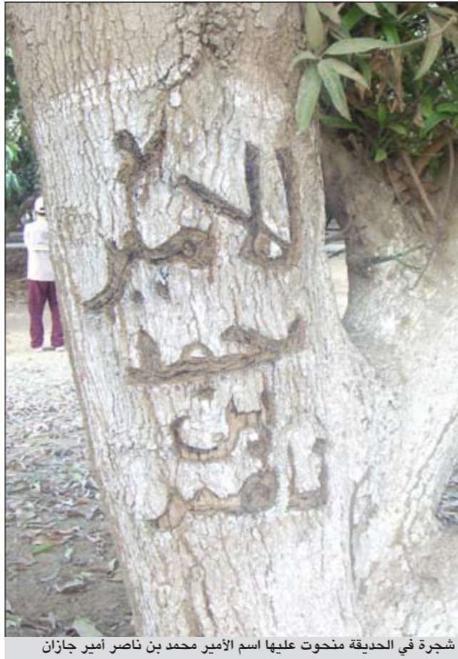
شجرة في الحديقة منحوت عليها اسم الأمير محمد بن ناصر أمير جازان