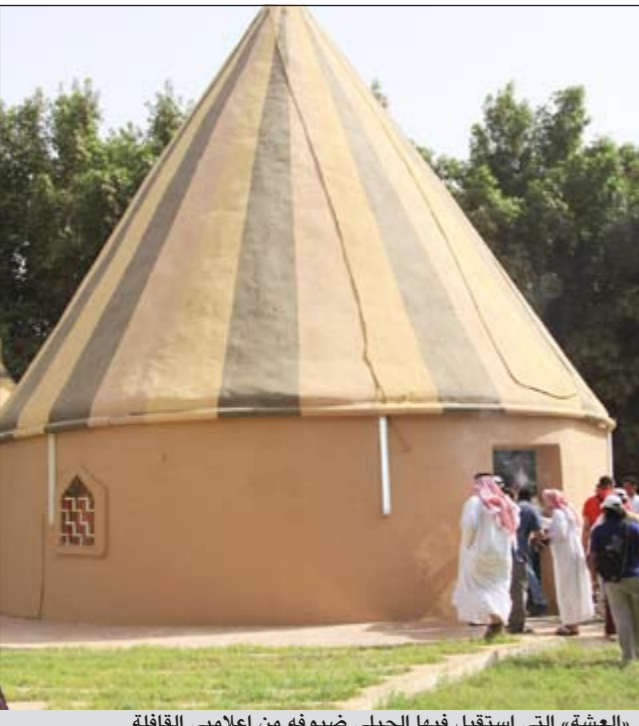
«العشة» التي استقبل فيها الجبلي ضيوفه من اعلامي القافلة