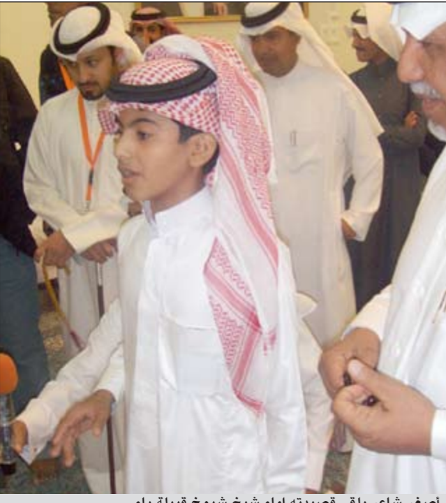
اصغر شاعر يلقي قصيدته امام شيخ شيوخ قبيلة يام