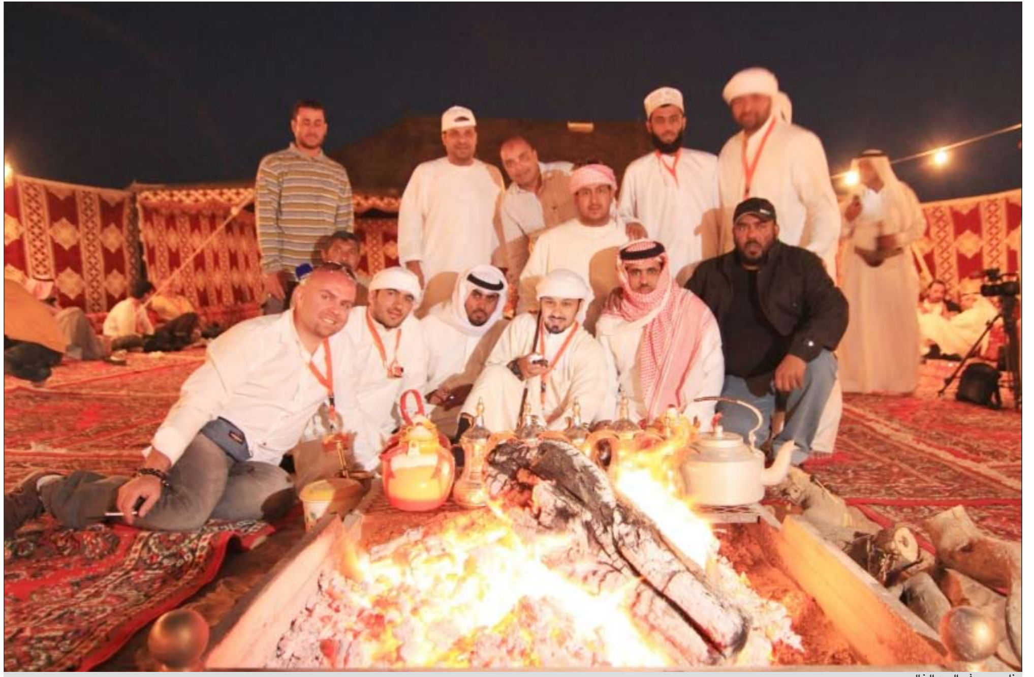
نار وسمر في الربيع الخالي