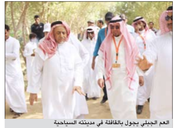
العم الجبلي يجول بالقافلة في مدينته السياحية