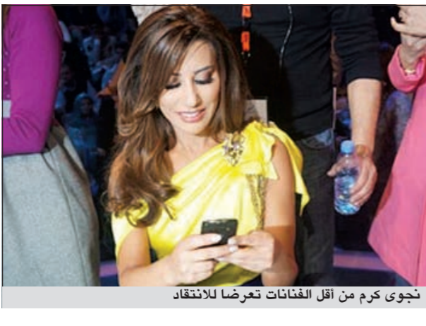
نجوى كرم من أقل الفنانات تعرضا للانتقاد