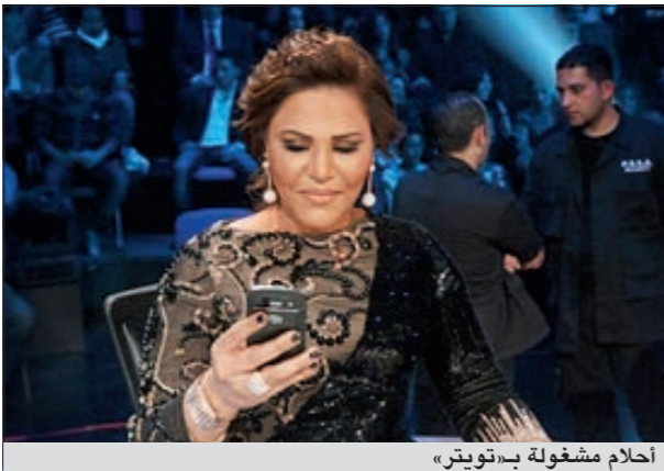
أحلام مشغولة بـ«تويتر»

أما أحلام التي دخلت عالم التغريد متأخرة مع انطلاق «أراب أيدول»، فقد شغلها هذا الموقع كثيرا، وسلب عقلها، وباتت لا تفارق حسابها حتى أثناء بث البرنامج الذي كانت تشارك فيه كعضوة في لجنة التحكيم، وكانت تشغل عن أداء المسلسلين بالرد على المغردين. وكذلك الأمر بالنسبة إلى رانغ علامة، وقد تعرضا للنقد لأنه بدلا من التركيز على أداء المتسابقين، كانا ينشغلان بكتابة تغريداتهما على «تويتر». ووسط هذا، تعتبر نجوى كرم، ونانسي عجم، ونوال الزغبى، وكارول سماحة أقل الفنانات تعرضا للانتقاد، حيث مازالت تغريداتهما عبر «تويتر» ضمن القبول، ولم يصلن إلى ما بلغته أحلام وهيفاء واليسا.