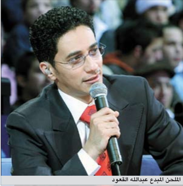
الملحن عبدالله القعود

ساهر، علي المعنوق، منصور الووان، وكذلك الموسيقار د.احمد الحمدان، هو وبدر