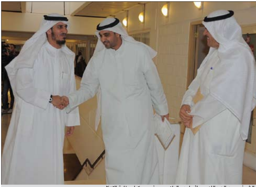
الشيخ محمد عبدالله مصافحا بدر الداوم بحضور وكيل وزارة الإعلام

اجتمعت أمس لجنة الشؤون التعليمية والثقافية البرلمانية، وناقشت بحضور وزير الإعلام الشيخ محمد عبدالله قانون المرئي والمسموع، بالإضافة إلى قانون جامعة جابر. وقال مقرر اللجنة النائب بدر الداوم: ناقشنا أمس الملاحظات على قانون جامعة جابر الذي أقر في مداولته الأولى وأخذنا في الاعتبار ملاحظات النواب والهيئة العامة للتعليم التطبيقي. وذكر الداوم: ناقشنا قانون المرئي والمسموع الذي كلفنا به من قبل المجلس، وكان هناك تعاون من وزير الإعلام بهذا الشأن، ونحن مع تطبيق القانون، خصوصا أن هناك وسائل إعلام لم تتقيد بنود القانون. وفي السياق نفسه، بين وزير الإعلام الشيخ محمد عبدالله المبارك أنه اجتمع أمس مع اللجنة التعليمية بشأن تكليف المجلس الخاص بتعيين تطبيق قانون