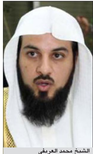
الشيخ محمد العريفي

أوهمت ان النبي صلى الله عليه وسلم ربما اهدى الخمر لما كانت حلالا كما يهدى أي سلعة حلال. وأضاف العريفي «بعد تأملي ظهر لي خطأ العبارة فأنا استغفر الله عن إيرادها»، وشكر العريفي في البيان سماحة مفتي المملكة والهيئة العامة للتعريف بالرسول الكريم، مذكرا بان أهل السنة والجماعة يجتزمون مقام النبوة.