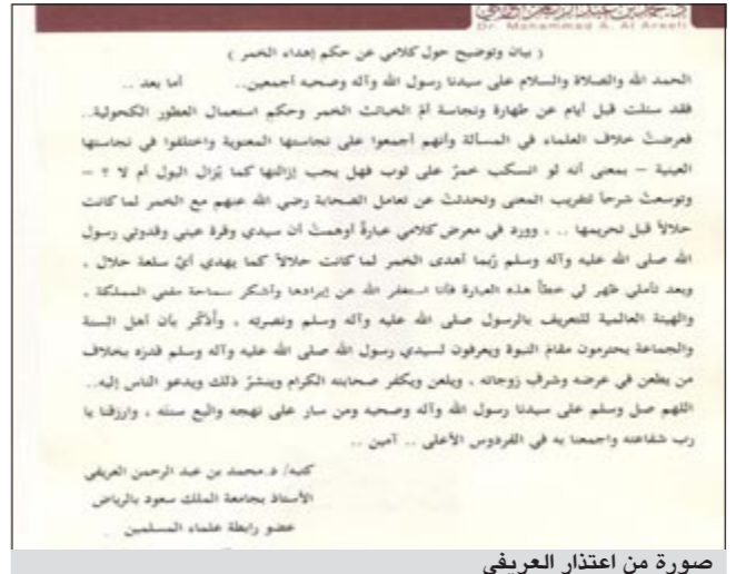
صورة من اعتذار العريفي