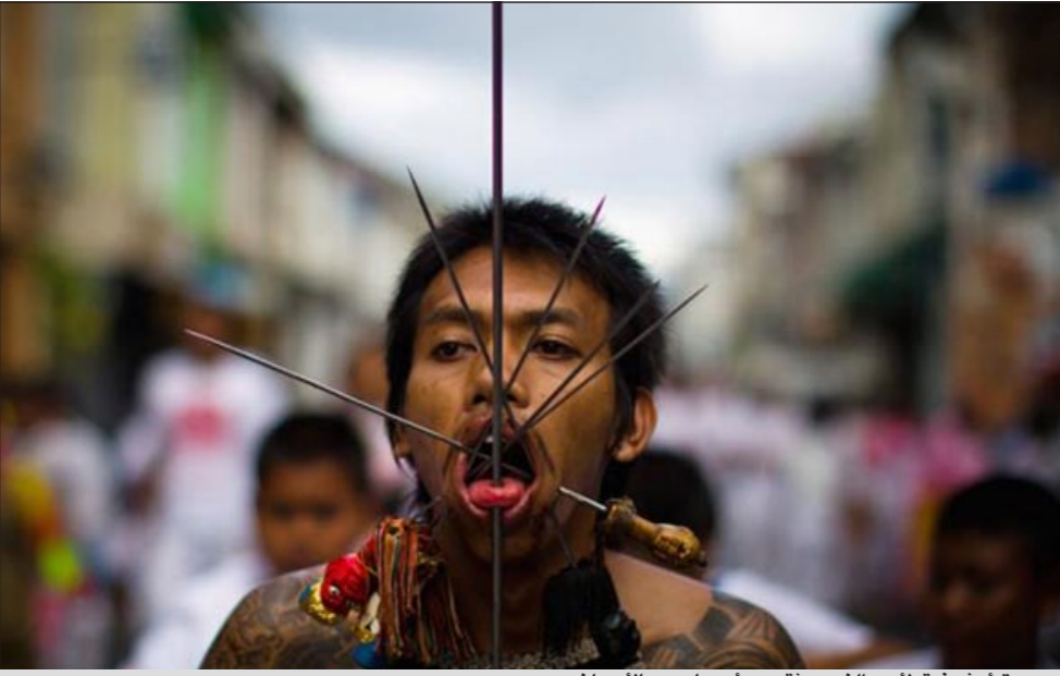
صورة أرشيفية لأحد الذين يقبون أجسادهم بالأسياخ

وقد تجمع نحو 130 درويشا يرتدون قلنسوات بيضاء على رؤوسهم وسترات سوداء على سجاويد الصلاة في التكية الضيقة وهي المكان الذي يتجمع فيه الصوفيون في بريزرين في جنوب كوسوفو انتظارا للشيخ فدري حسين شبحو. وعند وصوله شرح للمجتمعين باللغات الألبانية والتركية والصربية أنهم اجتمعوا للاحتفال بمولد علي مؤسس طريقتهم. واحتتم الاحتفال الذي دام ثلاث ساعات ونصف الساعة برقص دائري يثير التشوش وتشويه لأجسامهم. ويعترف الدراويش وهم الجناح الليبرالي من المسلمين الصوفيين بالحلب والتسامح تجاه الآخرين بغض النظر عن دياناتهم، وهم يكرهون الأصوليين والإرهابيين.