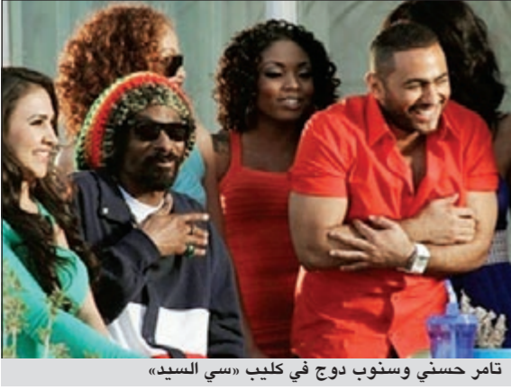
تامر حسني وسنوب دوج في كليب «سي السيد»