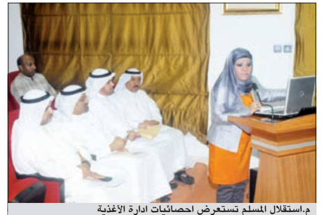
م.استقلال المسلم تستعرض إحصائيات إدارة الأغذية