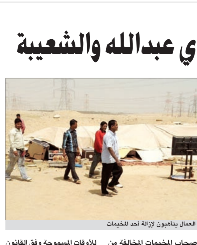
العمال يتأهبون لإزالة أحد المخيمات

مشيراً إلى أن الإزالة مستمرة حتى الانتهاء من جميع المناطق البرية الأخرى في المحافظة مثل «خط العبدلي - الجليعة - النويصيب». ولفت إلى أن البلدية ستباشر صباح اليوم تنظيف البر من بعض المخلفات عبر شركات النظافة التابعة للمحافظات، كما ستم إزالة أي مخيم لم تتم إزالته. وأوضح أن الخيام التي وجدت في المخيمات يتراوح عددها بين 3 و4 خيام في كل مخيم إلا أنه اتضح أن المخيمات مهمة وغطاها التراب، لافتاً إلى أن البلدية تحفظت على بعض الأجهزة الإلكترونية الموجودة داخل الخيام في مخازن البلدية.