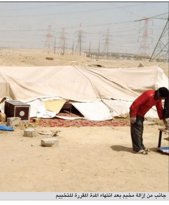
جانب من إزالة مخيم بعد انتهاء المدة المقررة للتخييم