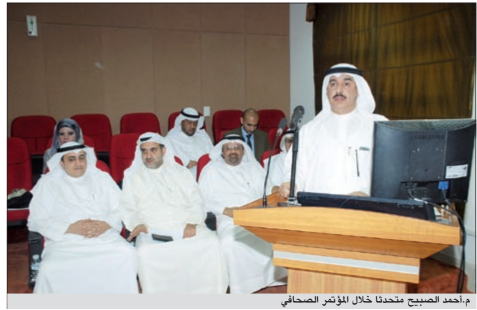
م.أحمد الصباح متحدثا خلال المؤتمر الصحفي

أكد مدير عام البلدية م.أحمد الصباح أن اللائحة الجديدة للأغذية تتضمن عقوبة تصل إلى 100 ألف دينار بالإضافة إلى الحبس 3 سنوات ضد تجار الأغذية الفاسدة، مشيراً إلى أن هذه اللائحة معروضة على مجلس الأمة لإقرارها.