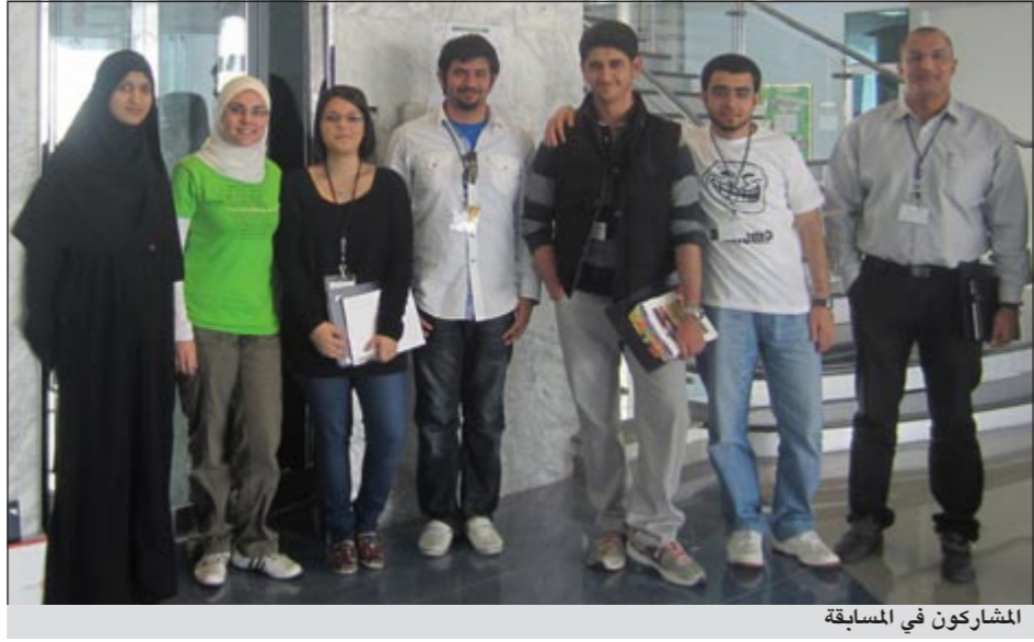
المشاركون في المسابقة