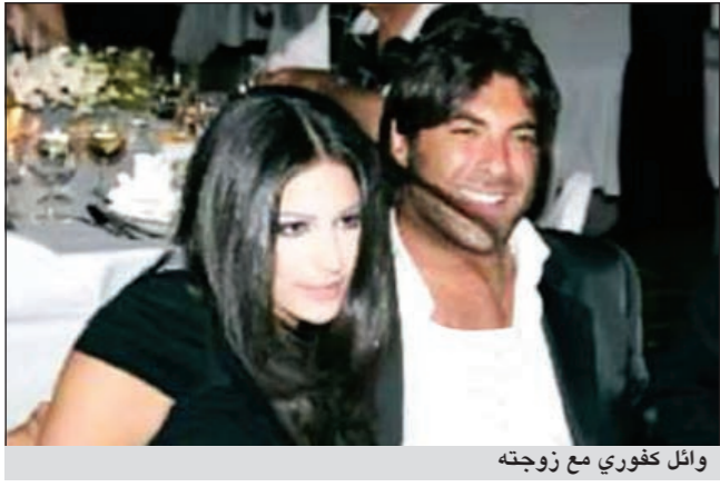
وائل كفوري مع زوجته

خلافات كبيرة وقعت هذه الفترة بحسب ما ذكر موقع «دنيا الوطن» بناء على مصادر صحافية بين الفنان وائل كفوري وزوجته، مما دفع الطرفين إلى البدء بمعاملات الطلاق بعد استبعاد أي احتمال لإعادة المياه إلى مجاريها.