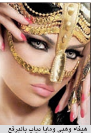
هيفاء وهبي ومايا دياب بالبرقع

عقدت مقارفة بين هيفاء وهبي ومايا دياب عبر صورة لهما وهما ترتديان البرقع الذهبي نفسه. وقد سبق لهيفاء أن ظهرت به على غلاف إحدى المجلات منذ أكثر من سنتين وحصدت الإعجاب بعدما بدت جميلة في الزي. وحاول عدد كبير من الفنانين بحسب «أنا زهرة»، تقليد النجمة اللبنانية، لكن تبقى هيفاء السبابة في عالم الصرعات والأزياء والأمور الغريبة. أما مايا فقد بدت غير جذابة بالبرقع، لتأتي نتيجة التعليقات لصالح هيفاء. علماً أنه لم يعرف سبب ارتداء مايا البرقع الذهبي، وما