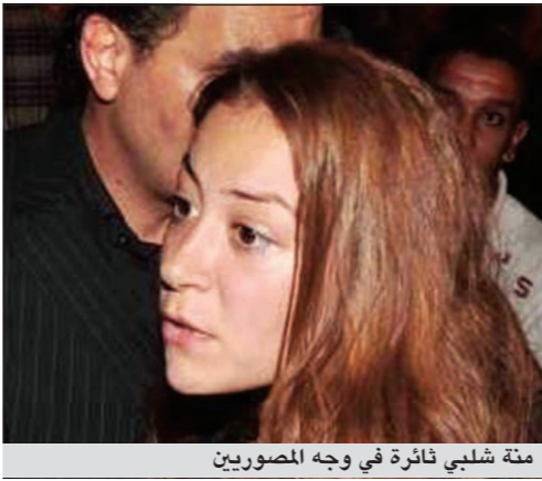
منة شلبي ثائرة في وجه المصورين

أثارت الفنانة منة شلبي استياء عدد كبير من الصحافة الغربية خلال «مهرجان تطوان لسينما البحر المتوسط» الذي تشترك فيه الممثلة الشابة كعضوة في لجنة تحكيم الأفلام الطويلة. جاء ذلك، بحسب ما ذكر موقع «أنا زهرة»، بعدما رفضت النجمة التقاط أي صورة لها، وغادرت القاعة بسرعة عند الانتهاء من عرض الأفلام المختارة. كما أثارت الكثير من الشكوك حول تصرفاتها، إذ لم تحضر الافتتاح الذي أقيم منذ أيام. وكان من المفترض أن تشترك فيه لتقدمها على خشبة المسرح. لكنها لم تظهر بل حضرت بعد يومين على الافتتاح، ثم خرجت بسرعة بمرافقة خاصة منعت المصورين من الاقتراب والتقاط الصور لها. ورفضت أيضاً التقاط الصور لها داخل القاعة ومع لجنة التحكيم.