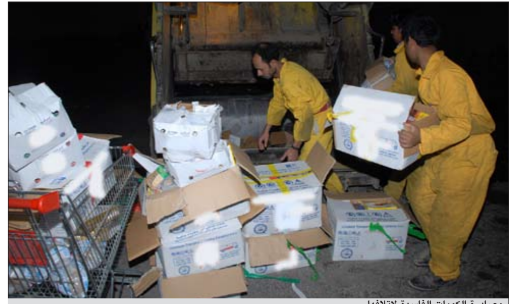
مصادرة الكميات الفاسدة لإتلافها