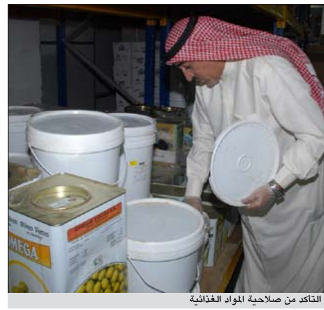
التأكد من صلاحية المواد الغذائية