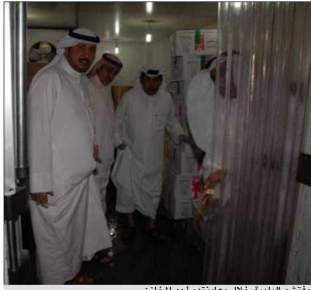
مفتشو البلدية خلال معاينتهم أحد المخازن

يعقد ببلدية الكويت في الساعة الثانية عشرة من ظهر اليوم الأحد مؤتمر صحفي لتوضيح ما أثير في الصحافة المحلية حول موضوع الأغذية بحضور