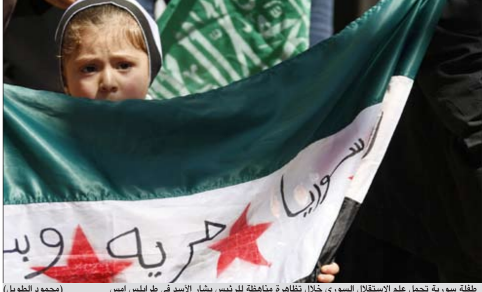
طفلة سورية تحمل علم الاستقلال السوري خلال تظاهرة مناهضة للرئيس بشار الأسد في طرابلس امس