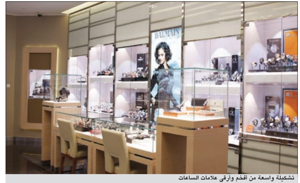
تشكيلة واسعة من أفخم وأرقى علامات الساعات

وبخبرة تزيد عن 75 عاماً في قطاع التجزئة في الكويت، فإن مجموعة بهبهاني تمتلك وتدير سلسلة من المعارض والمحلات الخاصة بماركات الساعات العالمية وكذلك الحل والمجوهرات، وتتوزع هذه المعارض في مجمعات شهيرة مثل مجمع الصالحية، سوق شرق، مجمع بهبهاني، مجمع الكويت، ليلي جاليري، المارينا مول والآن في الأقيوز.