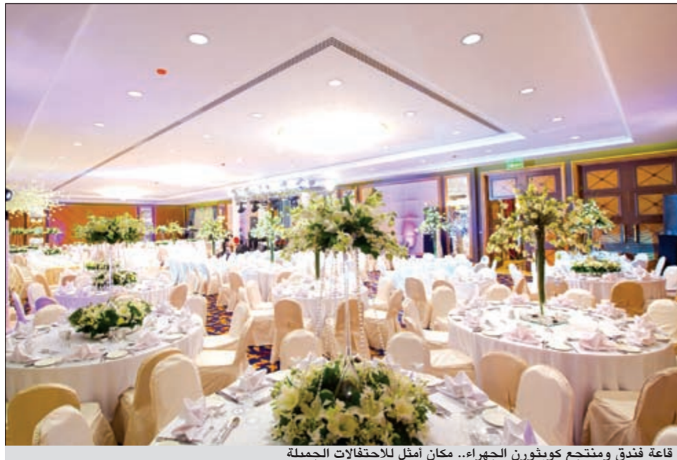
قاعة فندق ومنتج كويثورن الجهراء.. مكان أمثل للاحتفالات الجميلة

أطلق فندق ومنتج كويثورن الجهراء، والذي هو جزء من مجموعة ميلينيوم آند كويثورن للفنادق والمنتجعات، عروضه الجديدة والخاصة بالأزواج الذين يبحثون عن مكان مميز لإقامة حفل زفافهم. يقدم فندق ومنتج كويثورن الجهراء مجموعة من العروض لحفلات الزفاف الخاصة بالرجال والسيدات على حد سواء، ويعتبر المكان الأمثل للاحتفالات الجميلة، وكذلك التجهيز للقاعة لتلبية أنقى التفاصيل الخاصة بهذا الحفل، ويضمن هذا العرض الخاص للأزواج الراحة والطمأنينة وفرصة الاستمتاع بهذا اليوم المميز.