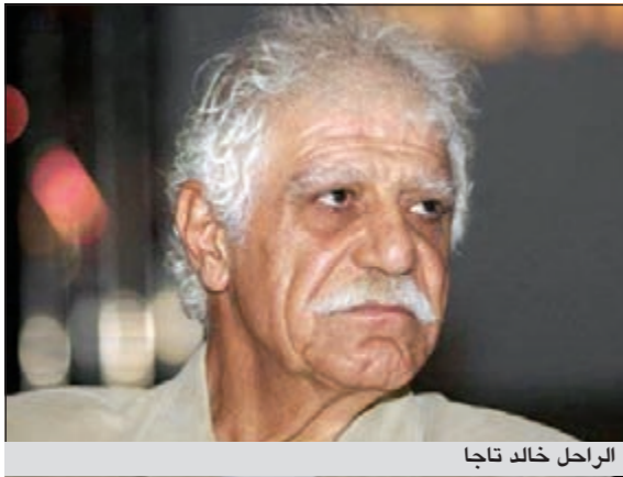
الراحل خالد تاجا

رحل امس الممثل السوري القدير خالد تاجا الملقب بـ«انطوني كوين العرب» بعد تعرضه لجلطة حادة أصابت رتيه منذ أيام، ما استدعى نقله بشكل طارئ الى مستشفى الشامي في دمشق.