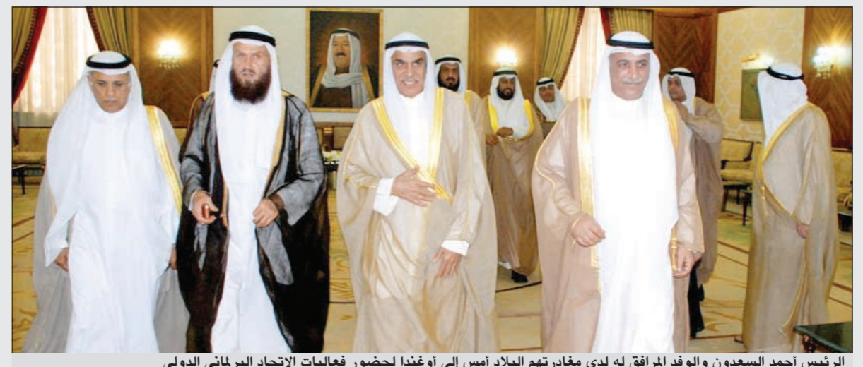
الرئيس أحمد السعدون والوفد المرافق له لدى مغادرتهم البلاد أمس إلى أوغندا لحضور فعاليات الاتحاد البرلماني الدولي

العديد من المحاور أو القضايا أهمها حماية بعض المتجاوزين في بعض المؤسسات الحكومية والكوادر والزيادات والمتقاعدين بالإضافة إلى قضية مخصصات المعاقين والقروض وصندوق المعسرین والتداول في البورصة والبنك المركزي. وأكد البراك في تصريح صحافي أن استجواب وزير المالية في القريب العاجل «قاب قوسين أو أدنى» وسيتم تقديمه بعد وضع اللمسات الأخيرة والنهائية عليه.