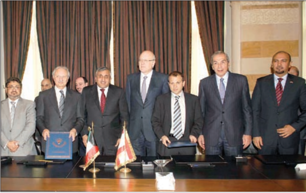
عبدالوهاب البدر ونجيب ميقاتي يتوسطان جبران باسيل ومحمد الصفدي عقب توقيع اتفاقية القرض

كويتي، أي ما يعادل حوالي 568 مليون دولار أميركي. كما قدم الصندوق للجمهورية اللبنانية معونة فنية واحدة بقيمة 700 ألف دينار كويتي أي ما يعادل حوالي 2,4 مليون دولار أميركي لتمويل إعداد دراسات الجدوى الفنية والاقتصادية لمشروع تطوير مطار رفيق الحريري الدولي، كما قدم لها الصندوق 6 منح بلغت قيمتها الإجمالية حوالي 2,7 مليون دينار كويتي، أي ما يعادل حوالي 9,2 مليون دولار أميركي لتمويل مشاريع في القطاع الصحي وتدريب الكوادر الحكومية. كذلك يتولى الصندوق إدارة منح حكومة دولة الكويت المقدمة للجمهورية اللبنانية وعددها 7 منح تبلغ قيمتها الإجمالية حوالي 119 مليون دينار كويتي أي ما يعادل 405 ملايين دولار أميركي لتمويل مشاريع في قطاع الصحة بالإضافة إلى إعادة إعمار لبنان وبناء متحف بيروت التاريخي.