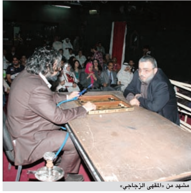
مشهد من «المقهى الزجاجي»