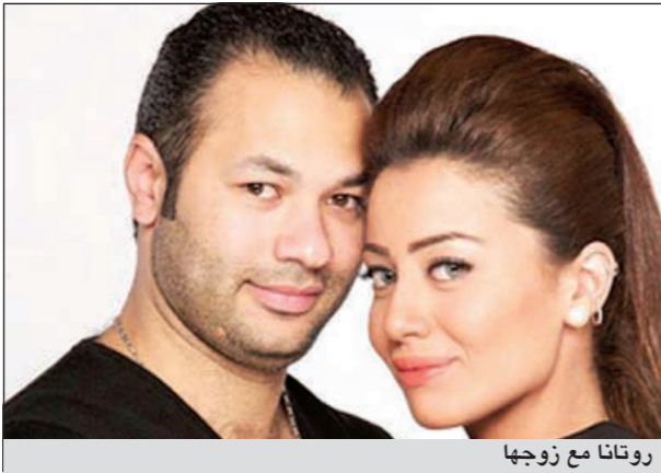
روتانا مع زوجها

الشبل من ذاك الأسد.. وسخر غيرهم من اسم روتانا، فعلق أحدهم بالقول: «هي دي روتانا سينيما وده جوزها روتانا موسيقي»، وسأل أحدهم كيف يسمى أحد ابنته باسم فتاة تلفزيونية، متسائلا ما إذا كان الزوج سيطلق على ابنته في المستقبل اسم «الجزيرة برس». مع العلم أن كلمة «روتانا» عربية وتعني نوعا من الثمر في المملكة العربية السعودية، وابنة غادة سعودية الجنسية وكانت الممثلة صرحت في العام الماضي بأن ابنتها ثمره زوجها السابق من شخصية سعودية ثرية.