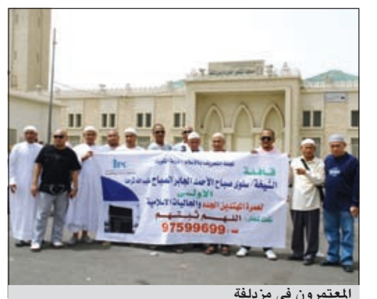
المعترون في مزدلفة