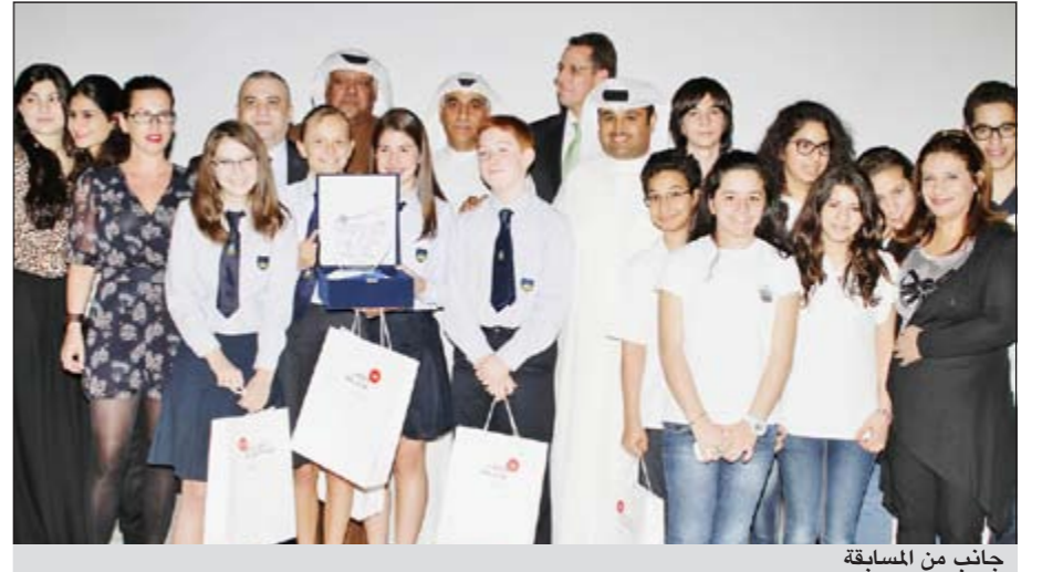
جانب من المسابقة

أعلنت شركة الوطنية للاتصالات عن رعايتها لمسابقة إعادة تدوير النفايات والتي نظمتها فندق ومبتعد موفنيك - البدر تحت عنوان «حافظوا على البيئة 2012»، وذلك بالتعاون مع الإدارة العامة للتعليم الخاص في وزارة التربية، وقد جرت المسابقة يوم 24 الجاري في فندق موفنيك - البدر. وتأتي رعاية «الوطنية» لهذا الحدث انطلاقاً من رؤيتها لتشجيع المبادرات طويلة الأجل، والتي تهدف إلى إلقاء الضوء على القضايا البيئية وتعزيز الممارسات التي من شأنها المحافظة على البيئة التي نعيش فيها علاوة على إيجاد وسائل توعوية وحلول لهذه القضايا. وقد تضمنت مسابقة «حافظوا على البيئة 2012» مؤتمراً صحافياً تحدث فيه ممثلو الشركات المحظية والرعية كما أقيم معرض على هامش الحدث ضم أعمال المشاركين.