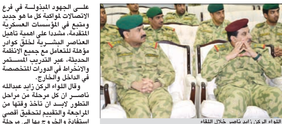
اللواء الركن زايد ناصر خلال اللقاء

على الجهود المبذولة في فرع الاتصالات لمواكبة كل ما هو جديد ومتبع في المؤسسات العسكرية المتقدمة، مشدداً على أهمية تأهيل العناصر البشرية لخلق كوادر مؤهلة للتعامل مع جميع الأنظمة الحديثة، عبر التدريب المستمر والانخراط في الدورات المتخصصة في الداخل والخارج.