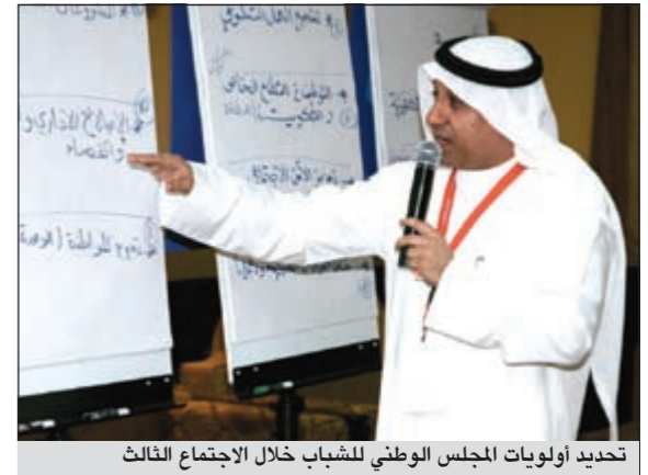
تحديد أولويات المجلس الوطني للشباب خلال الاجتماع الثالث