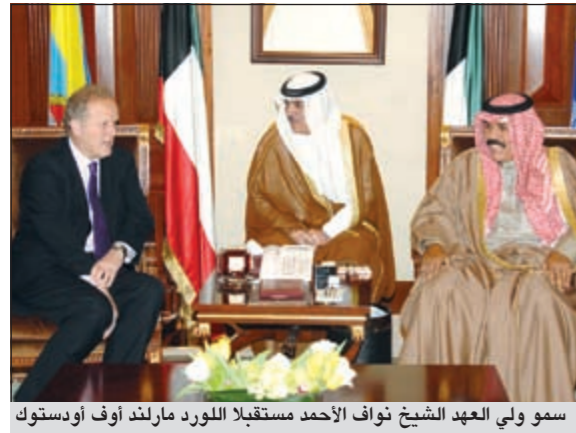
سمو ولي العهد الشيخ نواف الأحمد مستقبلاً اللورد مارلند أوف أودستوك

استقبل سمو ولي العهد الشيخ نواف الأحمد بقصر بيان امس رئيس جهاز الأمن الوطني الشيخ محمد الخالد. كما استقبل سمو ولي العهد الشيخ نواف الأحمد بقصر بيان صباح امس وزير الدولة لشؤون الطاقة والتغير المناخي بالملكة المتحدة اللورد مارلند أوف أودستوك والوفد المرافق له وذلك بمناسبة زيارته للبلاد.