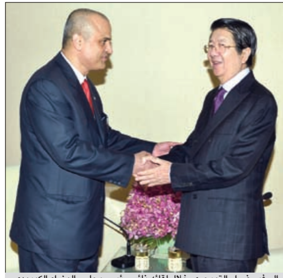
الوزير صرار التويزري خلال لقائه نائب رئيس مجلس الوزراء الكمبودي

كواليمبور - كونا: بحث سفيرنا لدى مملكة كمبوديا صرار التويزري سبل تعزيز وتوثيق العلاقات الثنائية مع نائب رئيس مجلس الوزراء لشؤون مجلس الوزراء سوك ان. وقال التويزري في بيان لـ «كونا» صدر امس ان اللقاء ناقش سبل تعزيز وتطوير التعاون المشترك بين البلدين لاسيما في المجالات الزراعية والسياحية والنقلية والعمل على تفعيل الاتفاقيات الموقعة بين البلدين.