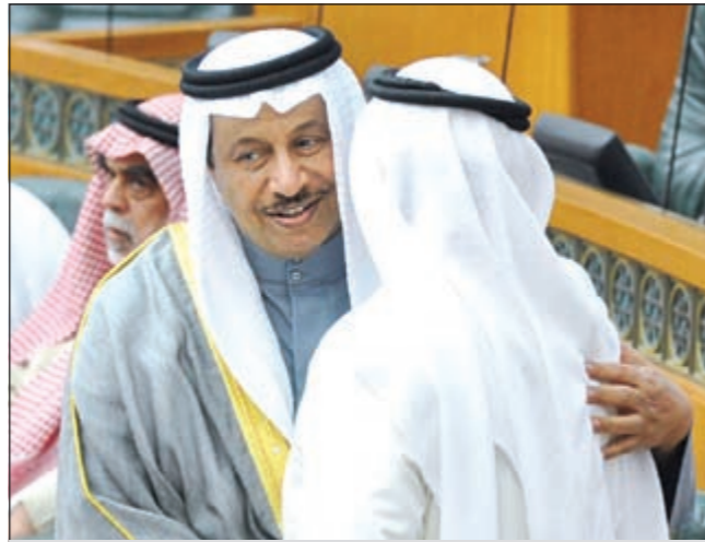
تحية متبادلة بين سمو الشيخ جابر المبارك وصالح عاشور قبل الاستجواب

حسين الرمضان - سامح عبد الحفيظ ناصر الوقيت - سلطان العبدان