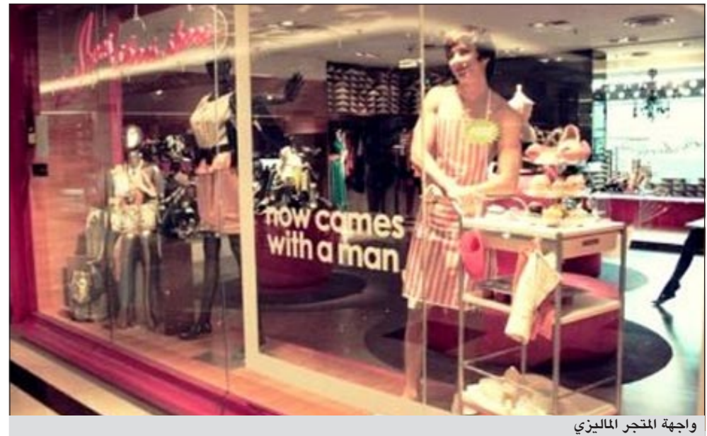
واجهة المتجر الماليزي

وفق ما نشرت مجلة «فوربس». وبموجب الصفقة، يبخن الرجال حذاء أعجبهم على الموقع الإلكتروني. وعند شراء سيدة هذا الحذاء يعرفها المحل بالمعجبين به، على أمل اشتعال شرارة الحب بينها وبين أحدهم فيما بعد. ولا يخفي المحل لهذا الغرض، بل يعد السيدات بخصم على شكل قسيمة شرائية يقدمها الشاب إلى الفتاة عند إتمام أول لقاء تعريفي بينهما. وعلى صفحة الموقع، تنوعت تعليقات القراء بين مؤيد للفكرة ورافض لها، على اعتبار أنها نوع من «دعارة الأحذية». وأوضح القائمون على الصفحة أنها عملية اختيارية، إذ تستطيع الزبونة أن تتيج قليلاً من المعلومات عن نفسها لترى من الرجل الذي شاركها الإعجاب بالحذاء نفسه، ويمكنها أن تلتقيه إن كان لديها اهتمام مسبق.