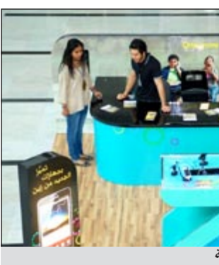
جانب من جولات «زين» التعريفية

مثل الخدمة والتي تعزز من عمليات التواصل للطلبة وفي نفس الوقت تعزيز تحصيلهم العلمي والأكاديمي، مبيّنة أن خدمة Zain campus لا تتوقف عن المكالمات والرسائل النصية المجانية فحسب، بل ستعطي الطلبة المشتركين فرصة للفوز بمميزات عديدة تقدمها الشركة مثل الحصول على عدد من التذاكر لدخول عدد من الفعاليات والبرامج والأنشطة والحفلات التي سيقومها زين في الفترات القادمة.