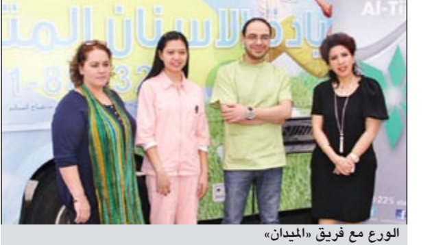
الورع مع فريق «الميدان»

في إطار حرص البنك التجاري الكويتي على تقديم كل سبل الرعاية الصحية لموظفيه ضمن برامج المسؤولية الاجتماعية للشركة، استقبل البنك عيادة الميدان لخدمات طب الفم والأسنان بالمقر الرئيسي بالبنك، لإجراء الفحص اللازم لموظفي البنك وتقديم النصح والإرشادات الطبية لهم والرد على جميع الاستفسارات المتعلقة بصحة الفم والأسنان وكيفية المحافظة عليها.