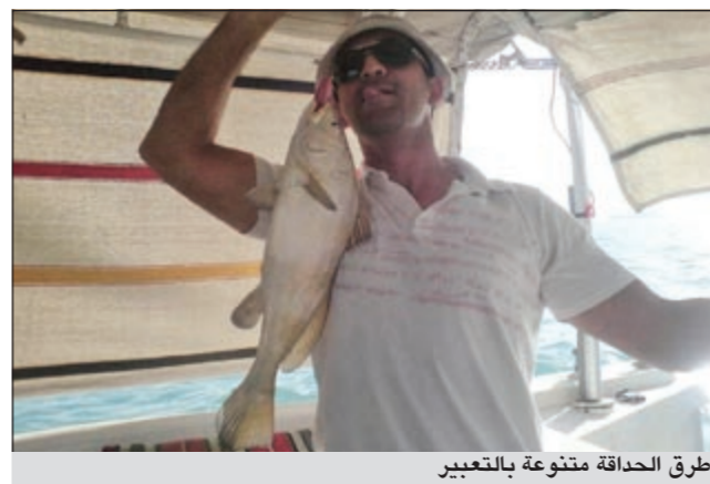
طرق الحدائق متنوعة بالتعبير

● أنا عاشق ومغرم بالبحر هذا أولاً واعتبر البحر دائماً بيتي الثاني وعشقي للبحر أبدي ولم أجد يوماً كلمات تعبر عن حيي وغرامي لهذا اللون الأزرق والمحاذق الشمالية مثل الركسة والدفان والطبعانات، لم اجد حتى يوماً هذا كثر عطائها وكما تحبها وتعشقها تعطيك، يا أخي المحاذق الشمالية شيء ثانٍ وجميلة فإينما تذهب وتقط خيطك تجد صيدا وإذا لم تجد صيداً ما عليك إلا