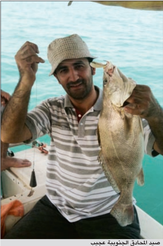
صيد المحاذق الجنوبية عجب