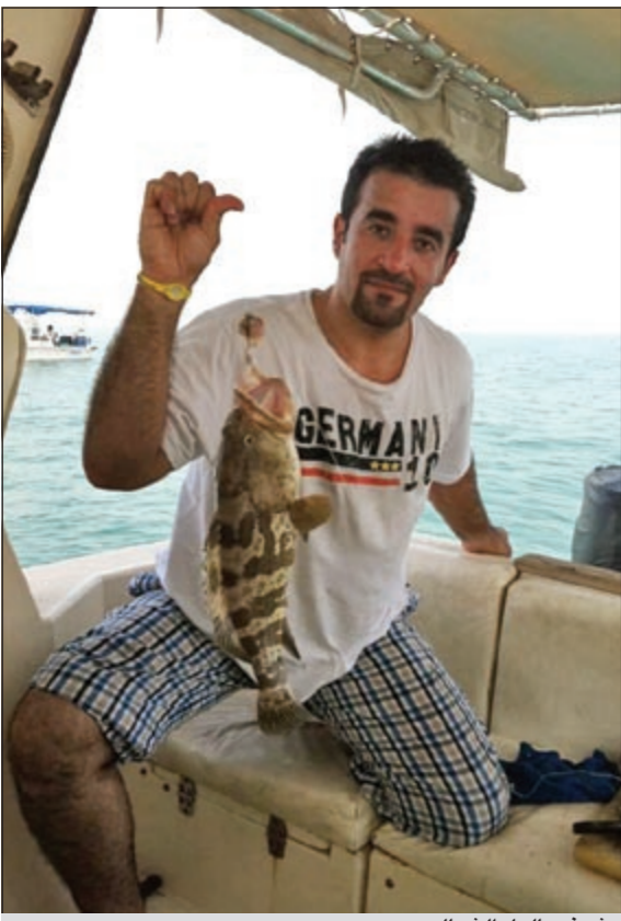
شوف بالول الشمال