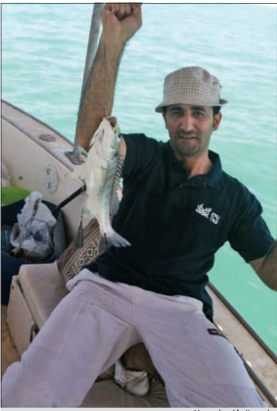
شعم الدفان شيء فان