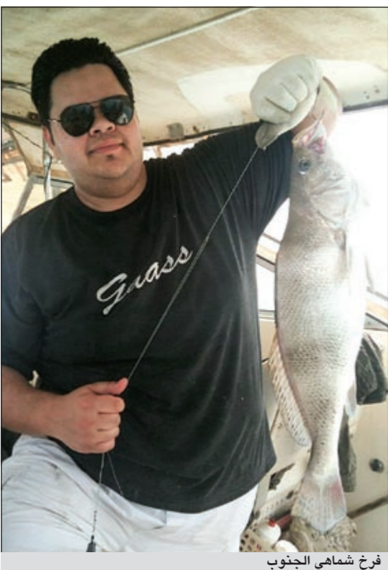
فرخ شمهي الجنوب