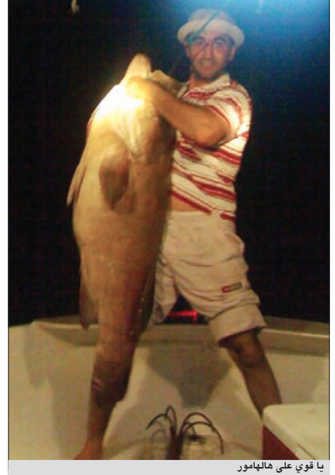
يا قوي على هالهامور