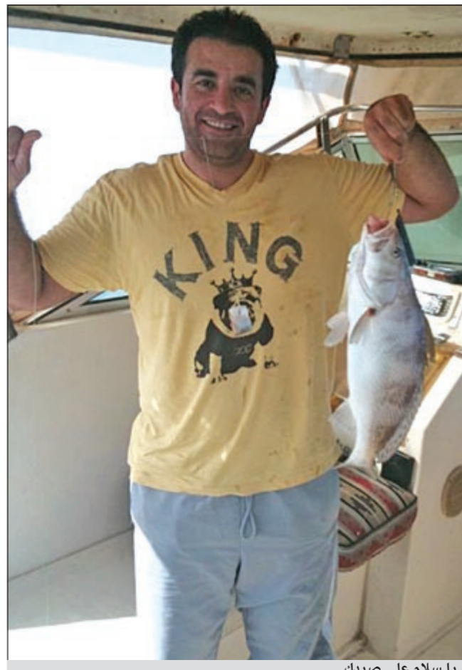
يا سلام على صيدك