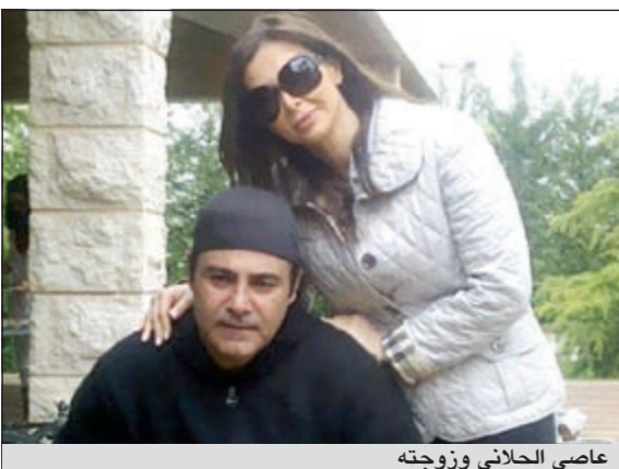
عاصي الحلاني وزوجته

نشر النجم اللبناني عاصي الحلاني على صفحته بـ«فيسبوك» صوراً وهو يدخن الشيشة مع زوجته أثناء عطلة نهاية الأسبوع التي قضاها في مزرعته الخاصة التي يملكها في منطقة الحلانية البقاعية بلبنان، ولم يكشف الحلاني أو إدارة صفحته عن السبب في نشر هذه الصور التي تكشف عن الحب المتبادل بينه وبين زوجته، إلا أن جمهور صفحته بـ«فيسبوك» اعتبرها رداً على تلك الشائعات التي انتشرت مؤخراً، والتي تتحدث عن انفصال حدث بينه وبين زوجته كولين بولس.