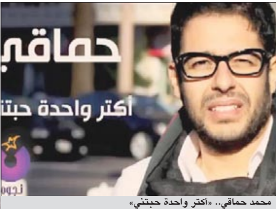
محمد حماتي.. «أكثر واحدة حبتي»

حققت أغنية «أكثر واحدة حبتي» للمطرب محمد حماتي أعلى نسبة مشاهدة على موقع «يوتيوب» حيث تخطى مستمعو الأغنية التي أنتجتها شركة نجوم ريكوردز أكثر من ربع مليون مستمع لها عبر صفحة نجوم أف أم الرسمية في أقل من 48 ساعة، ولم يكف مستمعو الأغنية على «يوتيوب» بسماعها ومشاهدتها فقط بل قاموا، بحسب جريدة «الوفد»، بتحميلها على صفحاتهم الشخصية على موقعي التواصل الاجتماعي فيس بوك وتويتر، والتي ازداد الأقبال عليها ووصل عدد مستمعيها إلى أكثر من 120 ألف مستمع.