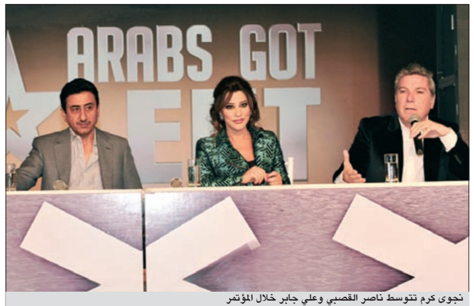
نجوى كرم تتوسط ناصر القصبي وعلي جابر خلال المؤتمر

أن يقال عن هذا الموضوع هو «فضيحة مفتعلة»، مؤكداً على مصداقية المحطة والشركة صاحبة البرنامج، شددت على أن البرنامج تمكن من استقطاب الآلاف من المواهب والمهارات العربية، وأنه رافعة للمواهب والمهارات لتتمكن من التعبير عن نفسها وإبراز قدراتها.