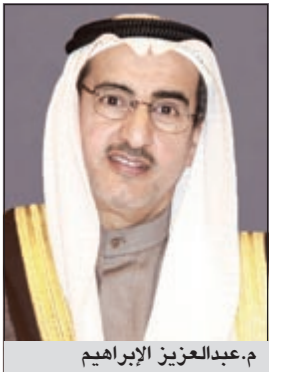
م. عبدالعزیز الإبراهيم

أكد وزير الكهرباء والماء ووزير البلدية م. عبدالعزیز الإبراهيم ضرورة تفعيل المقترحات والتوصيات الصادرة عن اللجنة العليا للتخطيط وتطويرها شريطة ان تكون «واقعية وقابلة للتطبيق ليتمكن تحقيق أهدافها المرجوة». وقال الوزير الإبراهيم خلال الاجتماع الدوري للجنة العليا للتخطيط أمس ان هناك أهمية لعقد لقاءات مباشرة بين المسؤولين بغية حل المشكلات والمعوقات وتوحيد الاجراءات مضيفا ان الاجتماعات التنسيقية ينبغي ان تكون خارج أوقات العمل الرسمي «وذلك حفاظا على وقت هذا العمل».